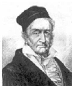
Carl F. Gauss

Gauss reconoció que, para ciertos valores de \alpha , \beta y \gamma , la serie incluía, entre otras, casi todas las funciones elementales. Por ejemplo: (1+z)^a = F(-a, b; b|-z) , \log(1+z) = zF(1, 1; 2|-z) , etc. También Gauss estableció la convergencia de la serie e introdujo la notación F(a, b; c|x) que convive todavía con la notación moderna {}_2F_1\left(\begin{smallmatrix} a, b \\ c \end{smallmatrix} \middle| x\right) . Otro trabajo importante de Gauss fue su Methodus nova integrali um valores per approximationem inveniendi , (Werke III, 163–196) donde demuestra una fórmula de cuadraturas para el cálculo aproximado (y