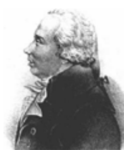
Adrien M. Legendre

donde r = \sqrt{(x - \xi)^2 + (y - \eta)^2 + (z - \zeta)^2} y, por tanto, calculando la integral es posible encontrar la función V . Esto, sin embargo, es complicado ya que es necesario conocer a priori la distribución de masa de los cuerpos, la cual es, en general, desconocida. Si a esto unimos el hecho de que el cálculo directo de la integral (1) suele ser muy engorroso –pues se trata de una integral triple que hay que integrar en un volumen acotado pero con forma arbitraria–.