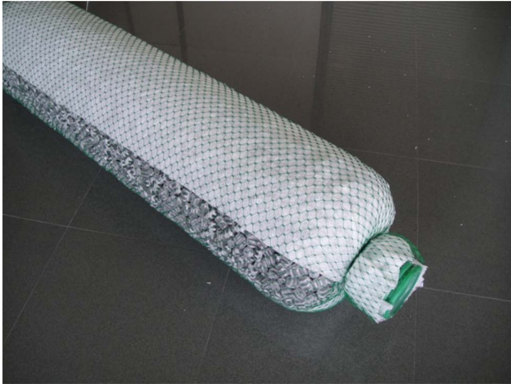
Imagen 1. Ejemplo de DFP

El DFP se presenta habitualmente en unidades de 3 o 6 metros en formato barra, que tiene un tubo de polietileno corrugado y ranurado en el centro y una capa de granulado de EPS rodeando al tubo. Está protegido por un geotextil filtrante y se cierra el conjunto con una malla de polietileno. Las barras se conectan mediante acopladores de plástico o manguitos.