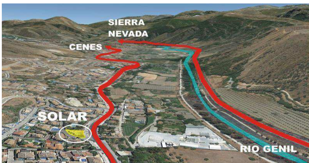
Fig. 2 “Relación del solar con el entorno. Viales y zonas verdes”

El solar en el que se ha ejecutado esta vivienda se encuentra en una zona con presencia de masas arbóreas por un lado y vías de circulación elevada por otro. Las masas vegetales están ligadas al cercano cauce del río Genil mientras que las vías