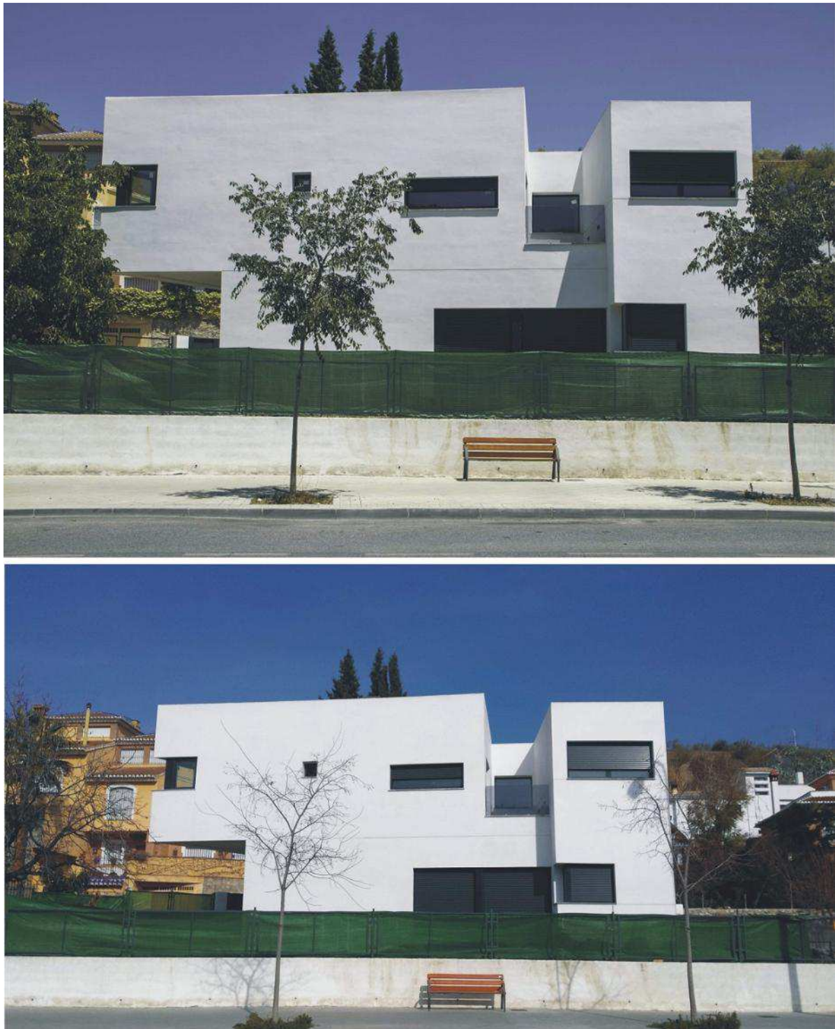
Fig. 9 “Comparación del acabado exterior. Julio de 2013 (arriba) y febrero de 2015 (abajo)”

Habiendo transcurrido casi dos años desde el final de la obra, el aspecto del revestimiento exterior de la vivienda sigue siendo excelente. Si comparamos las dos imágenes superiores (fig.9) vemos el estado de la fachada en julio de 2013 (arriba) y en febrero de 2015 (abajo). No se marca ningún defecto exterior y tampoco se ha depositado suciedad por sedimentación sobre la fachada.