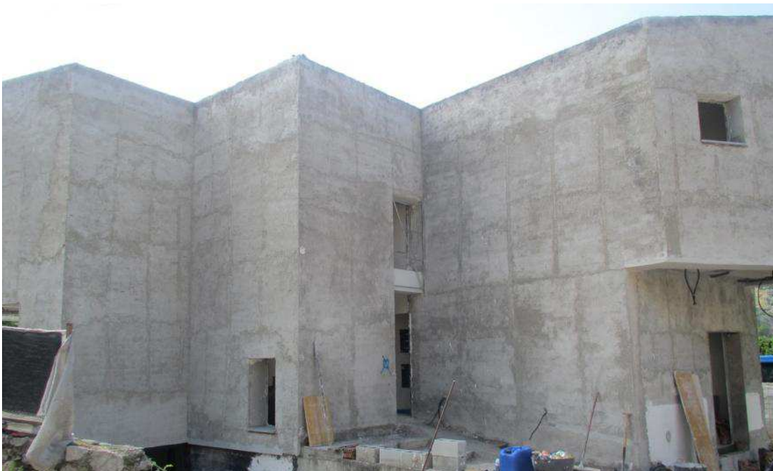
Fig. 7 “Control planeidad del mortero de cemento base del revestimiento fotocatalítico”

Como todos los enlucidos de acabado su escaso espesor hace imposible corregir los desperfectos del material de base, por lo que el control de la planeidad de la superficie se vuelve fundamental para el éxito final. En este caso se controlaba dicha planeidad mediante el uso de maestras y reglas cada dos metros. (fig. 7)