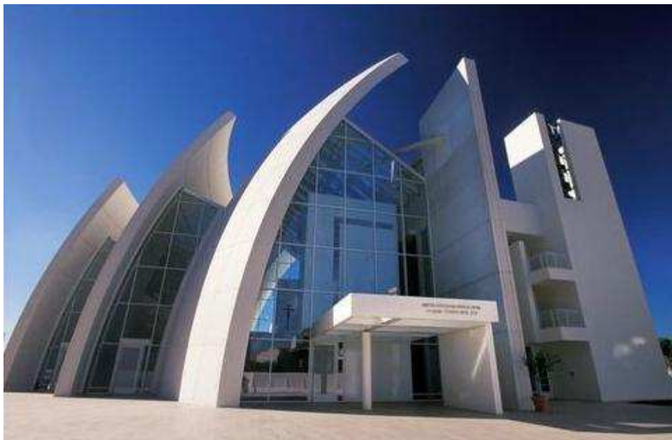
Fig. 4 “Iglesia Dives in Misericordia. Richard Meier.”

Conocíamos el uso de estos cementos fotocatalíticos en pavimentos de adoquines (Bérgamo) y en revestimientos como la villa Vodafone de Milán [3][5] o en la iglesia Dives in Misericordia de Richard Meier, en Roma (fig. 4). Este proyecto fue el ganador del concurso internacional «50 iglesias para Roma 2000» promovido por el Vicariato de Roma. Se caracteriza por tres imponentes estructuras creadas con elementos de hormigón prefabricados con cemento fotocatalítico que simulan tres enormes velas blancas. [1]