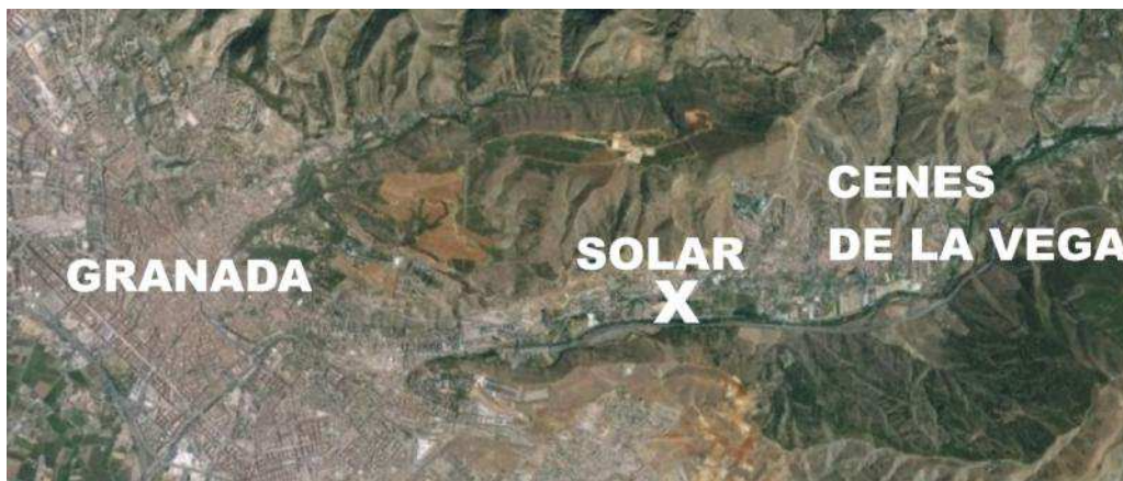
Fig. 1 “Situación del solar respecto a los municipios cercanos”

En la vivienda que vamos a tratar a continuación podremos ver como la situación de la misma en una zona periurbana consolidada (fig.1) nos proporciona variables que condicionan las decisiones sobre sistemas de instalaciones y revestimientos. Como veremos más adelante los revestimientos exteriores utilizados en esta vivienda incorporan el principio fotocatalítico. Es la primera vez que este material es utilizado en una vivienda de promoción privada en el sur de España, lo que convierte esta intervención como pionera en la introducción del material en una obra particular.