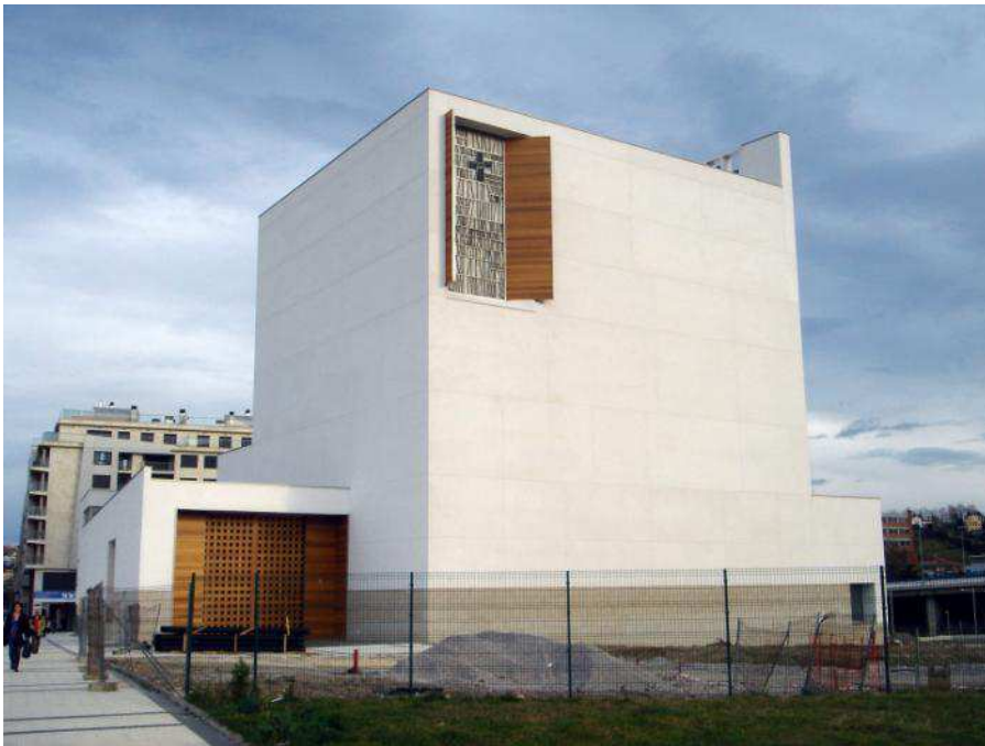
Fig. 5 “Iglesia Iesu. Rafael Moneo.”

Más cerca teníamos el ejemplo de la iglesia de Iesu, de Rafael Moneo (fig.5). Situada cerca del río Urumea, en el Donostiarra barrio de Loyola, constituye otro claro ejemplo del enorme éxito en la durabilidad del cemento fotocatalítico. Así el revestimiento utilizado en la vivienda nos proporciona un doble efecto de descontaminación y durabilidad, deseable en todas las intervenciones. Más adelante veremos el resultado en la vivienda ejecutada en Granada.