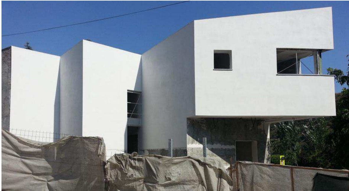
Fig. 8 “Aspecto de las fachadas durante la obra. Julio de 2013.”

Al igual que otros materiales de acabado final (enlucidos o monocapas) se hizo necesario el control de los cortes de paños, colocando perfiles que limitaban las jornadas de trabajo. (fig.8) Los volúmenes, aristas y los huecos de la vivienda marcaban las líneas de corte necesarias, huyendo en todo caso de las soluciones habituales.