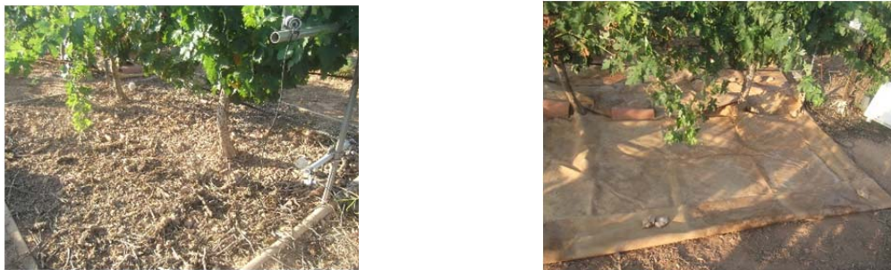
Figura 1. Suelo del lisímetro con restos de poda (izq.) y con una lona de plástico (drcha.).

Se llevaron a cabo tres ciclos de medidas en las siguientes fechas: del 12 al 17 de julio, del 26 al 31 de julio y del 9 al 14 de agosto. Cada ciclo consistió en mantener el suelo desnudo durante los dos primeros días, los dos siguientes se cubrió la superficie del lisímetro con un acolchado orgánico (restos de poda de la vid) y los dos últimos días se cubrió el lisímetro con un acolchado inorgánico (lona de plástico impermeable). Al inicio de cada periodo de 2 días se aplicó un riego de 3 horas (unos 5 mm) a las 8:00h am (hora local). De esta forma, se pudo analizar la reducción que se produce en la evaporación (E) con el acolchado orgánico, así como evaluar si con los restos de poda se sigue produciendo algo de evaporación al compararlo con la lona de plástico (evaporación nula). En la Fig. 1 se presentan dos imágenes del lisímetro con los dos tipos de acolchado utilizado. Los valores de ET_c de la vid se determinaron a partir de las pérdidas de masa en el lisímetro (por evaporación y transpiración) dividido por el área del lisímetro ( 9 \text{ m}^2 ). Los registros en que se produjeron ganancias de peso en el lisímetro (por riego), se eliminaron de los cálculos. En total se obtuvieron 462 registros de valores de ET_c cada quince minutos para cada uno de los ciclos de medida y tipo de suelo (desnudo, restos de poda y plástico).