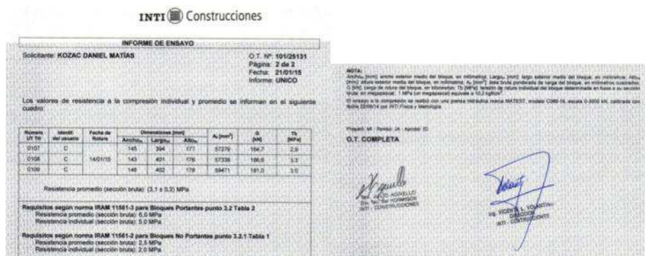
Fig. 8 “Ensayos a la compresión realizados en el INTI, Argentina”.

Tres bloques fueron ensayados en el Instituto Nacional de Tecnología Industrial (INTI) para Resistencia a la Compresión con resultados promedio de 3,10 Mpa, siendo aptos para muros no portantes (Fig. 8). Próximamente se realizarán ensayos de Absorción, Resistencia a la Compresión en Muros y Permeabilidad al Agua de Lluvia.