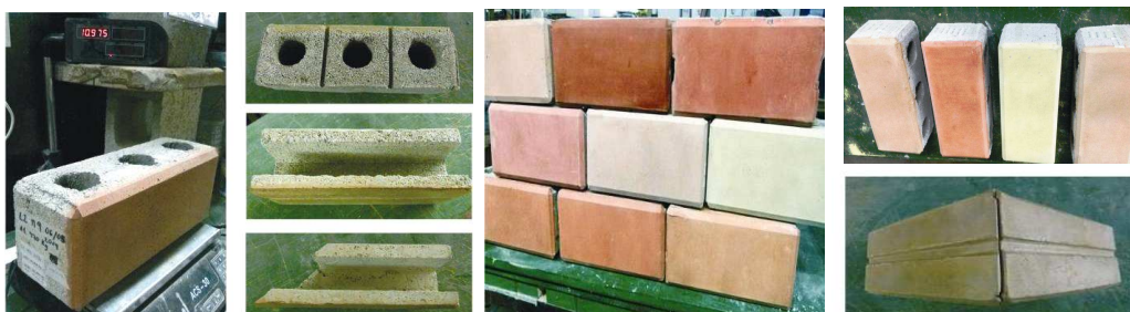
Fig. 7 “Distintas piezas del sistema de Bloques y pruebas de color”.

los m 3 retenidos como pago por el transporte y acopio virtual. La cooperativa no guardaría efectivamente esos m 3 sino que los podría vender a terceros, asumiendo el compromiso de reponer el material al tiempo que se necesite en la obra, con un aviso de anticipación pactada, tal como funciona un banco. Esto crearía un mercado de intercambio y valorización de un material de descarte como el EPS. Ya se logró un vínculo con la comunidad barrial a partir de la intervención de FADU Verde [8]. y el Hospital Italiano [9], distante 2 km de la obra de Olaya, que aporta semanalmente conservadoras de medicamentos para su triturado en obra.