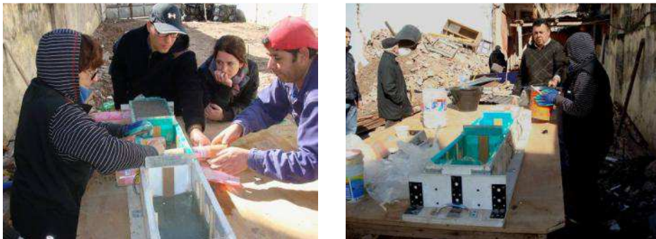
Fig. 6 “Capacitación en obra”.