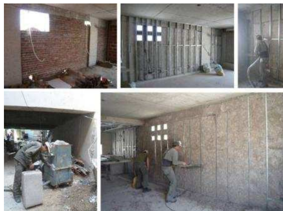
Fig. 2 “Aplicación de aislación de celulosa proyectada”.