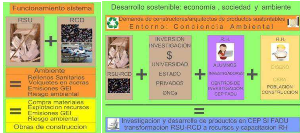
Fig. 5 “Demolición y recuperables, sistema productivo actual y Propuesta de refuncionalización del modelo productivo” [6].

armadas con ladrillos comunes. Este tipo de construcciones, muy corrientes en la Ciudad de Buenos Aires, al día de hoy presentan una importante falta de adecuación a normas vigentes sobre seguridad eléctrica, medidas de ambientes, iluminación y ventilación, conservación por humedades y deterioro edilicio muy importantes. Como resultado de la aplicación de estos indicadores surge la necesidad de demolerlas para desarrollo de nuevas propuestas [5]. La reutilización de los materiales demolidos es una cuestión de suma importancia en la actualidad.