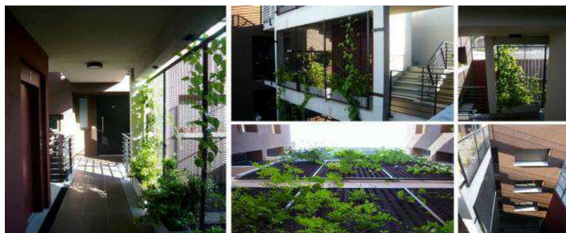
Fig. 3 “Patio y espacios de circulación con jardines verticales”.

La malla metálica y canteros en cada nivel sostienen el jardín vertical, cuyo fin es además brindar protección al ascensor y evitar que el agua de lluvia entre al pasadizo (con ese fin también se dispusieron rejillas “guardaganado” frente al ascensor). La iluminación artificial en la escalera y puente es activada a través de sensores de movimiento y fotocélulas.