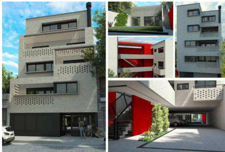
Fig. 4 "Imágenes exteriores".

Se trata de un edificio de planta baja y cuatro pisos, para cuyo proyecto se adoptaron soluciones similares a las utilizadas en el edificio Araoz 1459 en cuanto a sostenibilidad en arquitectura urbana (Fig. 4). La principal innovación en este caso está dada por la producción de mampuestos in situ a partir de materiales reciclados, y sobre este punto se concentra el análisis en esta sección.