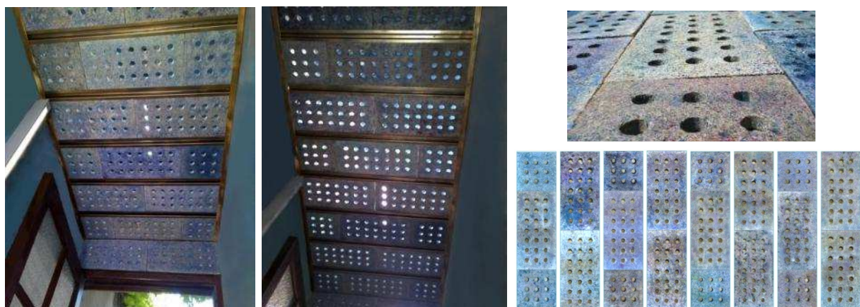
Fig. 4 "Placas utilizadas y Cielorraso del Hall terminado".

A partir de la comparación de productos de mercado, entre ellos el planteado en la tesis del citado Seminario (Superboard) [13d] y aplicando los criterios de los puntos 3.6 y 3.7, se optó por utilizar las placas para cielorrasos y revestimientos de paredes en papel cemento, diseñadas dentro del Proyecto SI de referencia (Ver Tablas 3, 4 y 5). Se descartó el uso de Superboard por su elevado peso unitario, las placas con fibra de vidrio por los desprendimientos de partículas y las de fibra de madera por su alto peso. Por otra parte, en todos los productos que no fueron seleccionados, se necesitaban cortes generando sobrantes y requiriendo más herramientas e insumos. Las placas fueron montadas en media hora por dos personas sobre perfiles omega decorativos, con resultado satisfactorio (Fig. 4). Se evaluarán sus ventajas y posibles inconvenientes a lo largo de dos años a partir de su colocación.