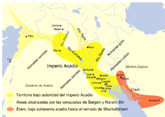
Figura 2. La unificación de Mesopotamia.

Enheduanna, nacida alrededor del año 2300 a.C., era hija de Sargón I el Grande o el Viejo (? 2334/2370 - ? 2314/2279 a. C.), Rey de Akad que al unir Sumeria y Acadia unifica por primera vez toda la cuenca de Mesopotamia bajo un mismo mandato, dando lugar a un gran reino en el que la dinastía sargoniana se mantuvo durante 140 años, entre los siglos XXIV y XXIII a.C.