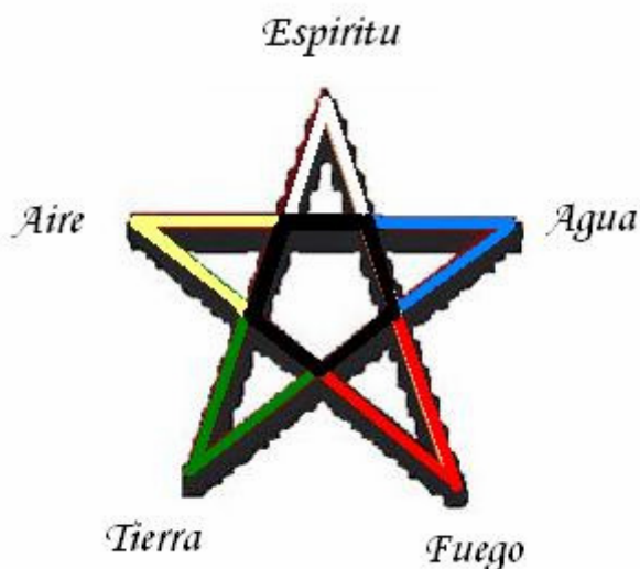
Figura 7. El pentagrama

Las principales obras que se le atribuyen a Teano son una biografía de Pitágoras, un teorema sobre la proporción áurea, varias aportaciones a la teoría de números, a la teoría de poliedros regulares, a la cosmología, al origen del Universo, a la Física, la Medicina, a la Psicología infantil y un trabajo “Sobre la Piedad”. Además, Teano escribió muchas cartas a amigos y conocidos, en las que exponía parte de su sabiduría adquirida.