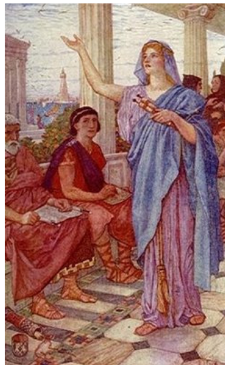
Figura 6. Teano enseñando en la escuela

Teano fue considerada un modelo de mujer, madre, esposa y filósofa para las demás mujeres; escribió numerosos tratados sobre matemáticas, física y medicina y fue precursora de la investigación científica.