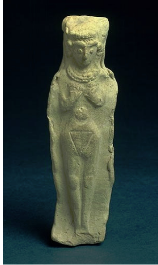
Figura 3. Enheduanna

La importancia científica de Enheduanna proviene del hecho de que Sargón tenía la potestad de dar altos cargos a miembros de su familia, iniciando esa tradición con Enheduanna. Eso le permitió a ella poder tomar parte desde una edad muy temprana en la actividad política desarrollada por su padre, por lo que pudo asumir un papel estratégico en el espacio religioso como Gran Sacerdotisa vinculada a Nanna (diosa de la luna) y a Inanna (diosa del cielo y de la fecundidad) en la ciudad de Ur, y ello le permitió controlar los conocimientos matemáticos y astronómicos de Sumeria y Babilonia, haciendo construir observatorios dentro de los templos, elaborando los primeros mapas sobre movimientos celestes y creando el primer calendario religioso (todavía en uso por algunas religiones).