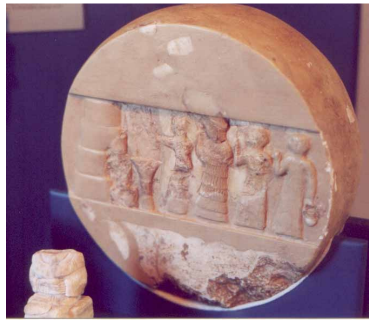
Figura 4. Inscripción en disco de alabastro

En general, los hombres y las mujeres mesopotámicas no tenían los mismos derechos, si bien es cierto que en periodos tempranos las mujeres podían comprar, vender, atender a asuntos legales en ausencia de los hombres, tener sus propias propiedades, prestar y pedir prestado e incluso realizar negocios por sí mismas.