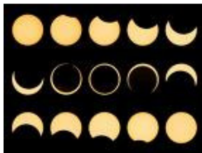
Figura 9. La “desaparición” de la Luna

Aglaonike alcanzó gran popularidad en Grecia, más por la maldad divulgada acerca de ella que por sus méritos científicos, llegando a aparecer en escritos de Platón, Apolonio de Rodas, Horacio y Virgilio entre otros, lo que contribuyó a granjearle el desprecio de sus coetáneos. Sin embargo, parece que Aglaonike pudo usar este temor infundado hacia su persona como manera de manipular, siendo así respetada por miedo a sus posibles conjuros que hacían desaparecer los astros del cielo. “ Quien podía hacer desaparecer la Luna ” era el apelativo con que se conocía a Aglaonike, un “sobrenombre” que denotaba más temor que admiración.