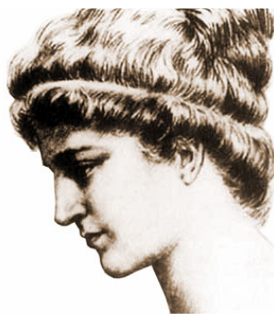
Figura 5. Teano de Crotona

Teano, nacida en Crotona en el año 546 a.C., es para muchos autores la primera mujer matemática de la Antigüedad, a pesar de que en la escuela de los pitagóricos, donde ella estudió, también estudiasen otras mujeres (en la “Vida de Pitágoras” del historiador Giamblico, aparece un listado de estudiantes de esta escuela en el que figuran 17 mujeres).