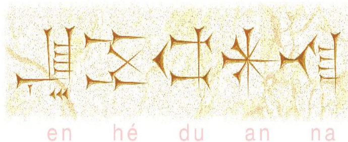
Figura 1. El nombre de Enheduanna

El nombre de Enheduanna (en otros textos aparece escrito Hedu'anna u otras caligrafías parecidas) proviene en su lengua original babilonia de las palabras: En (gran sacerdotisa), Hedu (ornamento) y Anna (del Dios del Cielo).