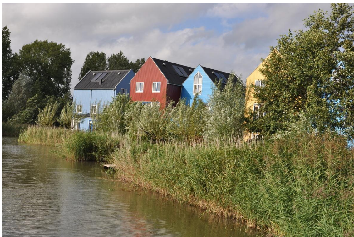
Fig. 9. Erasmusveld, 2008, (imagen: el autor)