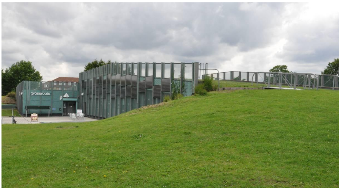
Fig. 1 Grassroots Community Center, Eger Architects, Londres 2005, (imagen: el autor)