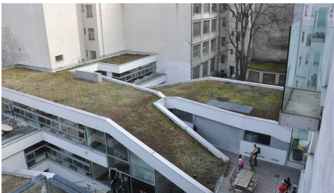
Fig. 4. Wimbergergasse Townhouse, Delugan & Meissl, Viena, 2001, (imagen: el autor)