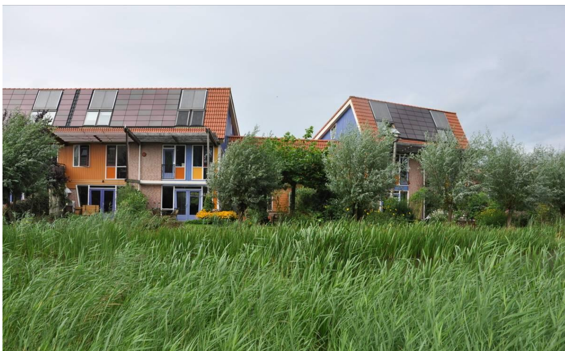
Fig. 8. Erasmusveld, 2008, (imagen: el autor)