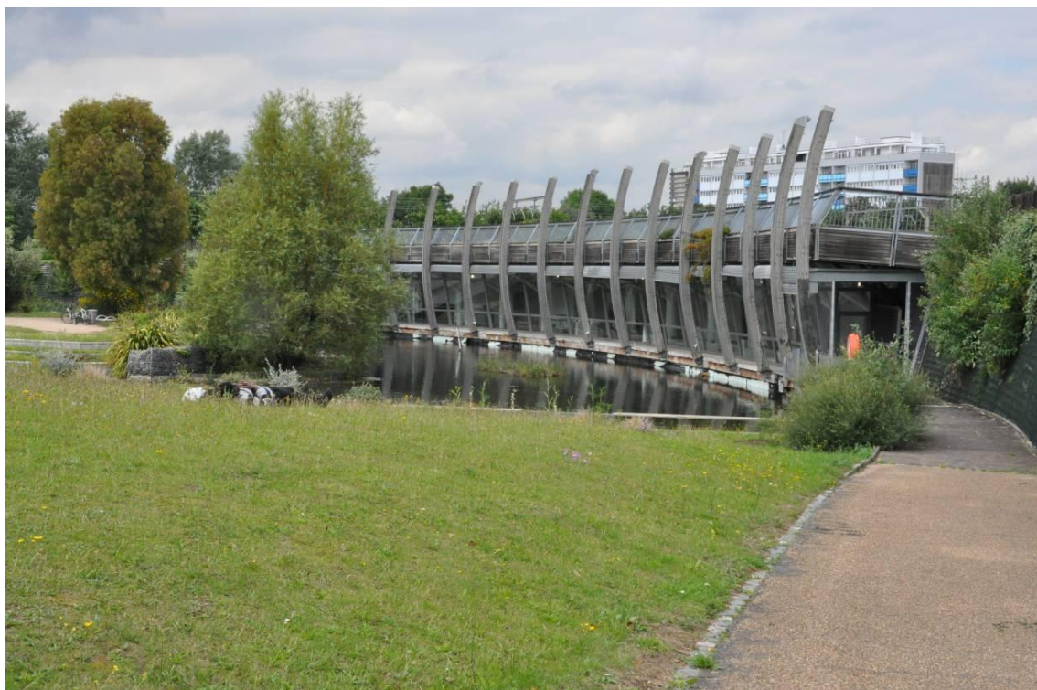
Fig. 2. Ecology Pavilion, Mile End Park, Tibbalds TM2, Londres, 2000, (imagen: autor)