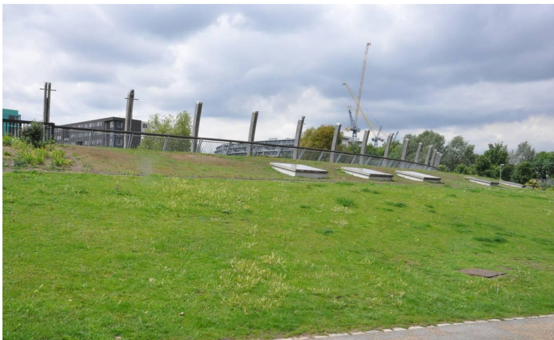
Fig. 3. Ecology Pavilion, Mile End Park, Tibbalds TM2, Londres, 2000, (imagen: el autor)