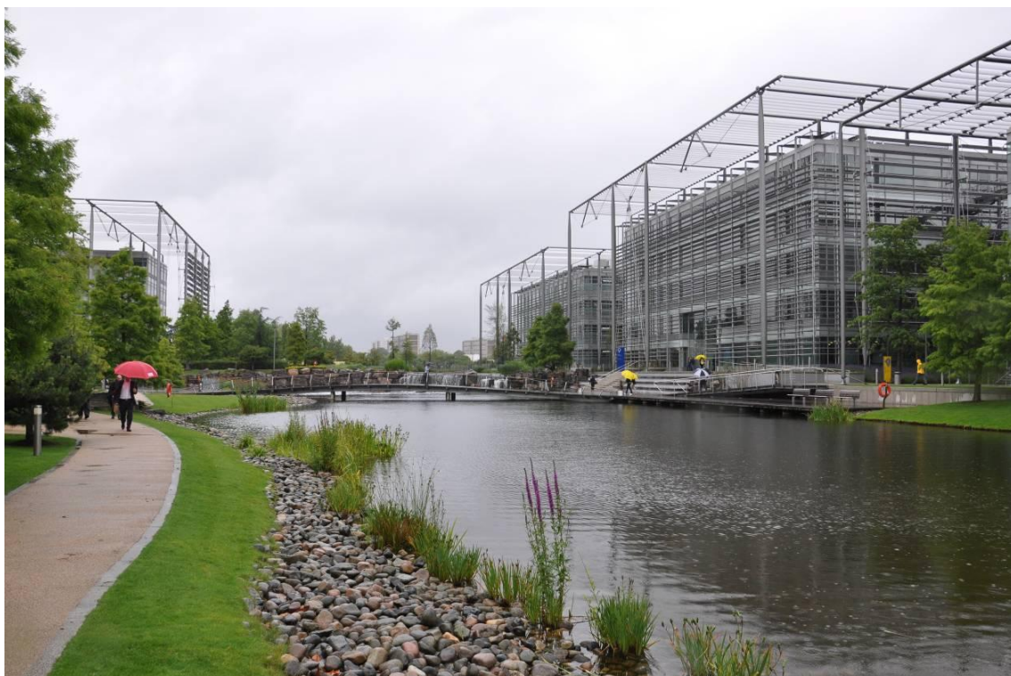
Fig. 7. Chiswick Park, Richard Rogers Partnership, Londres, 2000-2010