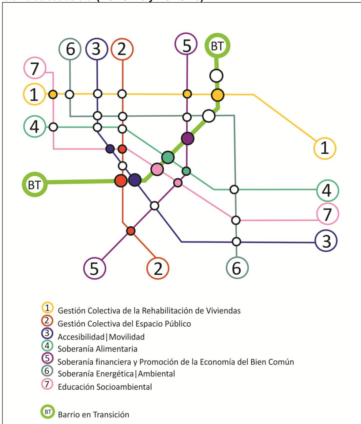
Esquema de Nodos activados desde HYD 2012-2013 en Alcosa

Desde el eje de Soberanía alimentaria se ha estudiado la viabilidad de sistemas de comercio de proximidad con los huertos productivos de la zona norte del barrio, informando a agricultores y comercios locales de experiencias que se están dando ahora mismo en otras zonas de la ciudad como la red de consumidores-productores, sistema de cestas etc. ( NODO 7-5 y NODO4-5 ).