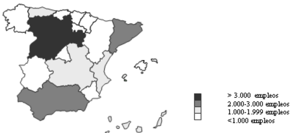
GRÁFICO 1. Mapa del empleo generado por el turismo rural en España por Comunidades Autónomas