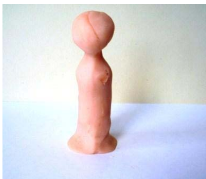
Fig. 2. Título: "Sin posibilidades", autora E.