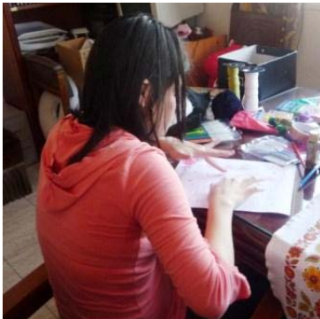
Fig. 4. Durante el Proceso de creativo.

Como investigadora y arteterapeuta empleo como técnica de investigación una cámara de video y el diario de campo, estos registros provienen de la observación directa, es un sistema visual y narrativo donde se registra todo aquello que resulta relevante del proceso de creación individual, grupal y las interacciones entre las participantes del grupo. En algunas sesiones se realizaba un visionado de los videos con las mujeres con el propósito que ellas pudieran observarse en sus procesos creativos y escuchar sus conversaciones, de esta manera logran apreciar la relación que establecen con los diversos materiales y su proceso creativo.