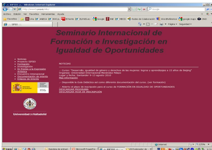
Figura 3. Página web del SIFIO

Por último, la sexta línea de actuación, la “Evaluación del Programa”, ha tenido como objetivos la reflexión sobre el proceso y el análisis de los efectos del programa de cara a valorar sus méritos y, con ello, el aprendizaje para futuras experiencias. Esta línea de trabajo da contenido al objetivo 13 del citado Plan Estratégico, “Incorporar la perspectiva de género en los procesos de evaluación del sistema educativo”, y a la actuación 13.2. (Eje 4. Educación).