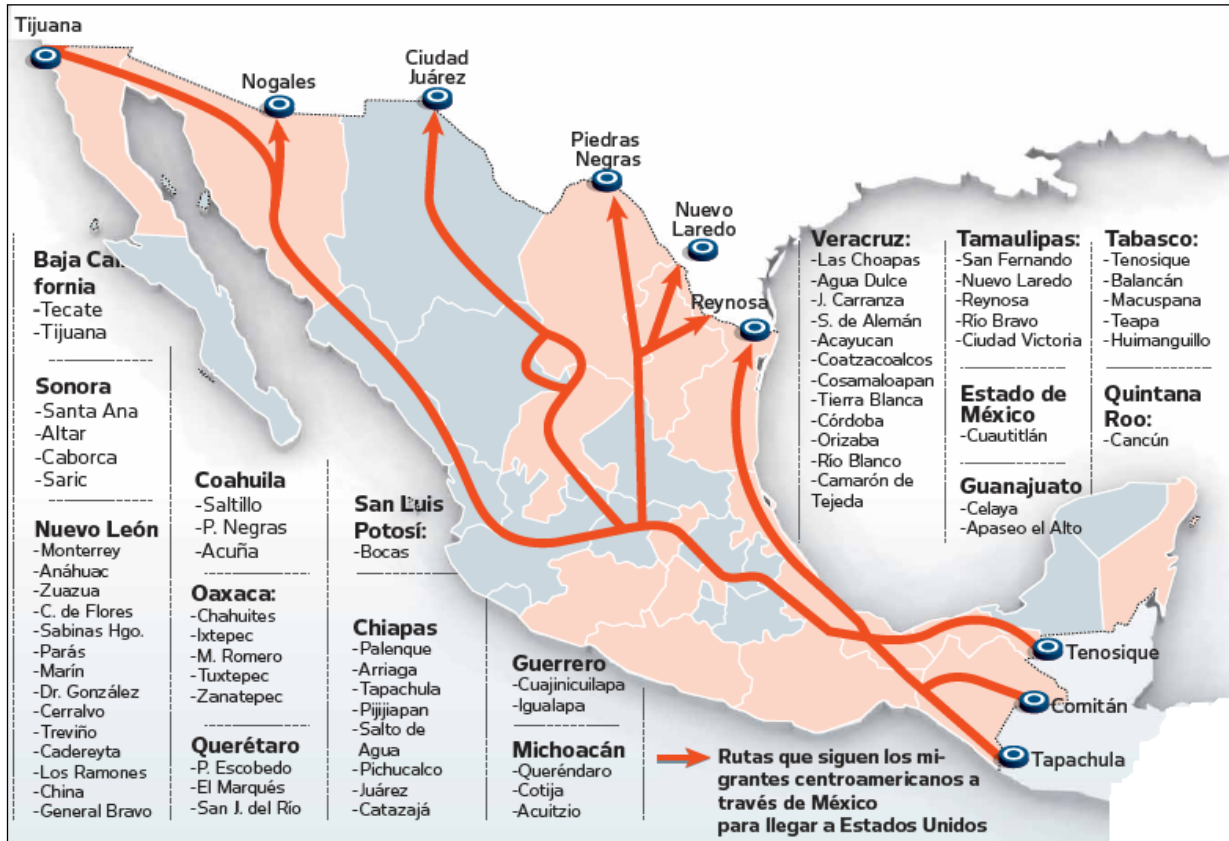
Gráfica N° 1. Rutas de riesgos de los movimientos migratorios femeninos de Centroamérica a través de México para llegar a Estados Unidos