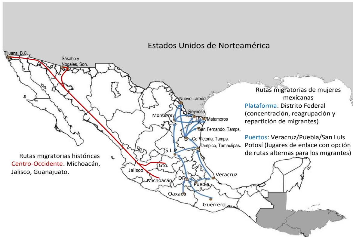
Gráfica N° 3. Rutas de mujeres migrantes mexicanas y centroamericanas indocumentadas

Fuente: Elaboración propia del trabajo de campo del proyecto: “Mujeres indocumentadas: historias de transgresión, resistencia, sumisión y reacomodo como estrategias de viaje. Una perspectiva socioeducativa” . UPO-Sevilla, El Colef.