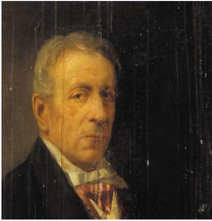
Duque de Rivas (1791 - 1865)