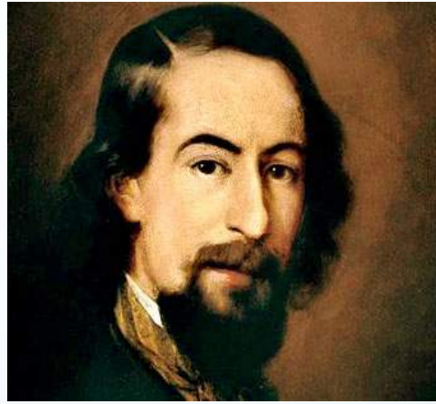
José Zorrilla (1817-1893)