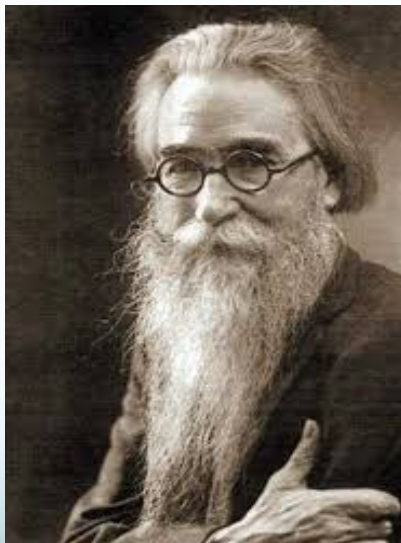
Ramón María del Valle-Inclán (1866 - 1936)