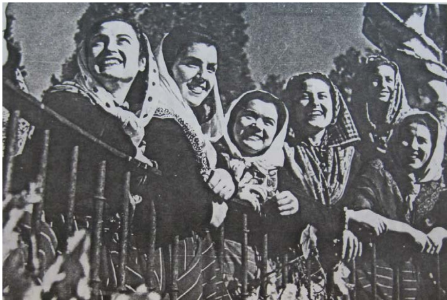
Grupo de Coros y Danzas de la Sección Femenina de Granada en el IV Concurso Nacional de Coros y Danzas en Madrid, celebrado el 24 de septiembre de 1945 con el Tercer Premio Nacional en mixtos.