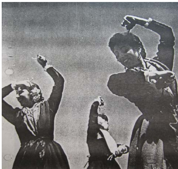
Coros y Danzas de Granada en uno de sus Festivales