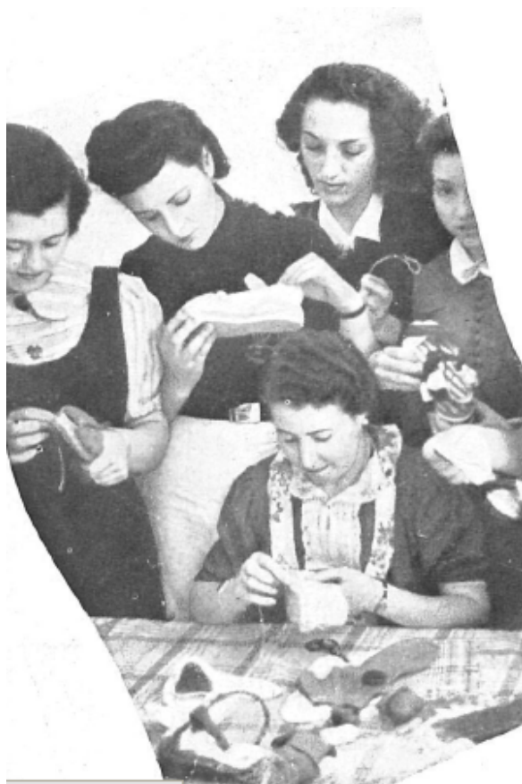
Fotografía que muestra las labores de artesanía ejercidas por las mujeres de Sección Femenina.