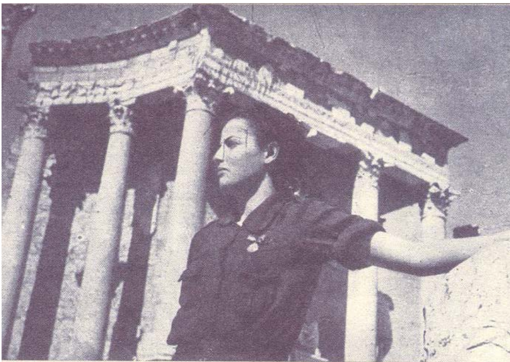
Foto de la Revista Medina , publicada en la tesis Imagen de una metáfora circunstancial, la mujer falangista como mujer moderna . Revista Y.