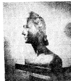
«Retrato», por Olga Añel de Ref.