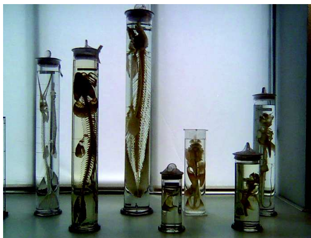
Figura 1. Colección de esqueletos de peces conservados en líquido.