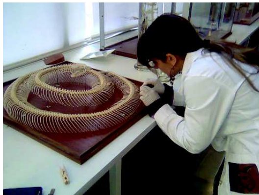
Figura 3. Alumna trabajando en el montaje de un esqueleto de serpiente pitón

La cantidad y diversidad de los materiales que atesora el Museo permite también su utilización en procesos docentes superiores, generalmente de carácter predoctoral, como la realización de Tesinas, Diplomas de Estudios Avanzados (DEA), trabajos de fin de Máster (TFM). Además, aunque los Planes de Estudio actuales no contemplan el trabajo sistemático de todos los alumnos en actividades de Museo por razones prácticas de espacio y tiempo, es en estos niveles avanzados cuando los alumnos pueden incorporarse de forma voluntaria a colaborar con el Museo en labores de montaje de ejemplares nuevos o en la conservación de los ya existentes.