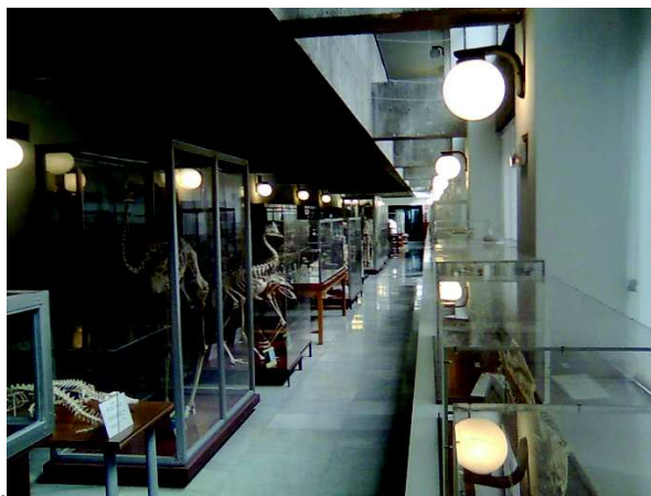
Figura 2. Vista panorámica de los locales del Museo.

Actualmente el Museo se ubica en el edificio B de la Facultad de Biología, en la planta semisótano, con acceso directo tanto desde el interior como desde el exterior