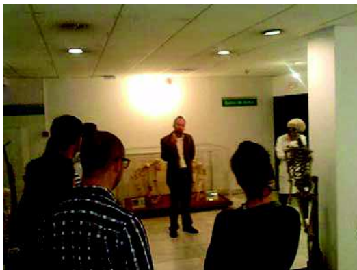
Figura 4. M. Domínguez-Rodrigo (Instituto de Evolución Humana en África) dando una conferencia sobre biomecánica en la sala de primatología.

Además, y como actividad docente complementaria en estos niveles avanzados, el Museo organiza reuniones, talleres especializados y conferencias de reputados especialistas que atraen a estudiantes predoctorales como una forma más de ampliar horizontes para sus futuras carreras docentes, investigadoras o profesionales.