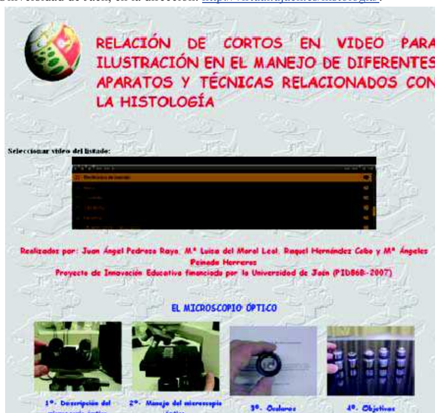
Fig. 2. Página web desde donde se accede a los videos

El conjunto de archivos de video (35 en total) se han organizado en una página web, para su más cómoda visualización a través del navegador de Internet (Fig. 2). Esta página se encuentra alojada actualmente en el servidor de la Universidad de Jaén, en la dirección: http://virtual.ujaen.es/histologia/ .