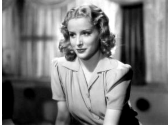
5. Película el "Gato Montés", 1935 y su actriz fetiche, María Mercader.