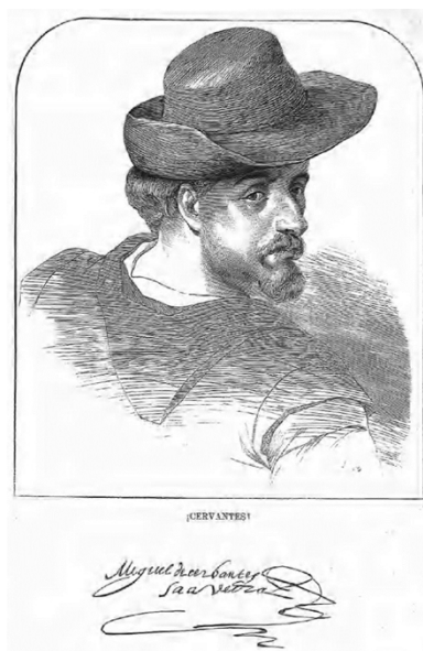
Figura 4. Retrato de Miguel de Cervantes . Grabado. 1872. La Ilustración de Madrid .