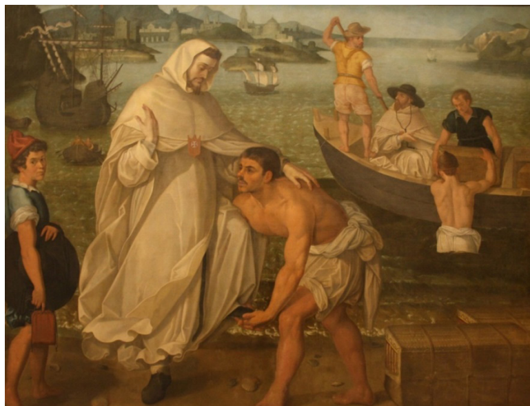
Figura 1. San Pedro Nolasco redimiendo a los cautivos . Francisco Pacheco. 1600-1611. Museo de Bellas Artes de Sevilla.