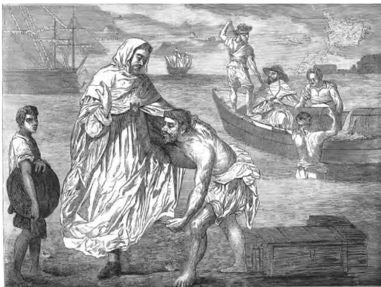
Figura 3. San Pedro Nolasco redimiendo a los cautivos . Grabado sobre pintura de Francisco Pacheco. 1872. La Ilustración de Madrid .