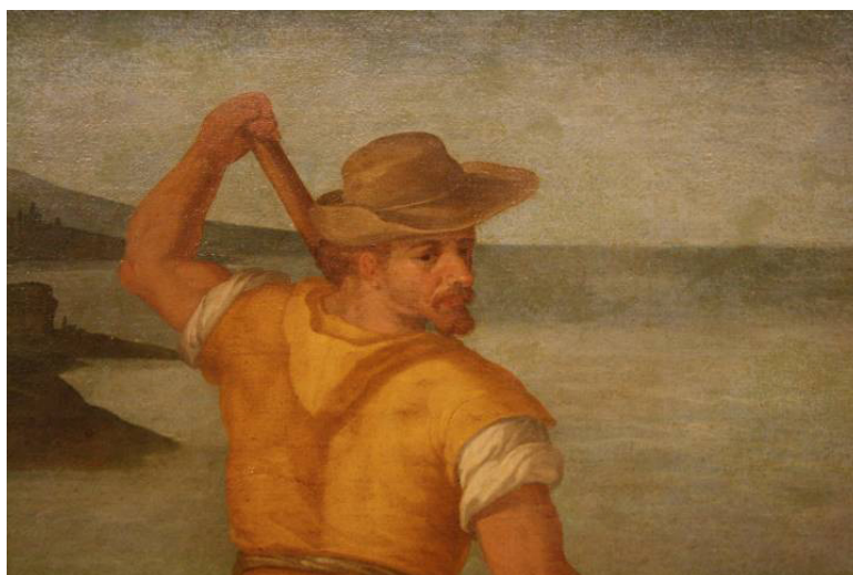
Figura 2. Detalle del barquero en San Pedro Nolasco redimiendo a los cautivos . Francisco Pacheco. 1600-1611. Museo de Bellas Artes de Sevilla.