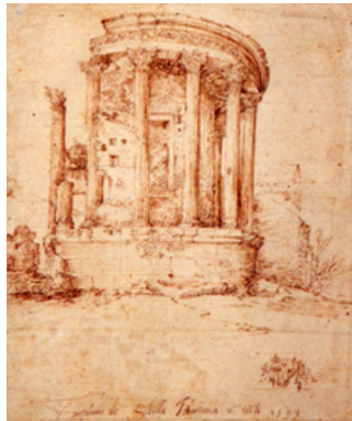
Figura 3. Jan Brueghel el Viejo, dibujo del templo de la Sibila de Tívoli en Roma (1593), Fundación Custodia, Paris.