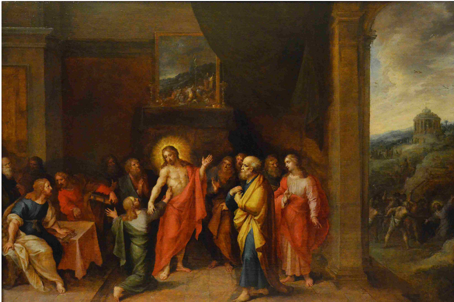
Figura 1. Frans Francken II, La incredulidad de Santo Tomás , colección privada.