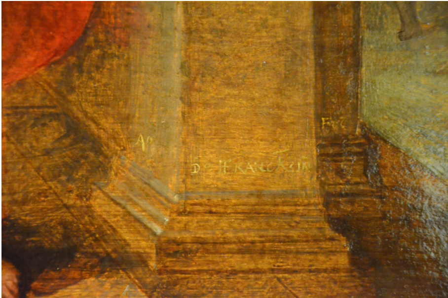
Figura 6. Frans Francken II, La incredulidad de santo Tomás (detalle de la firma).