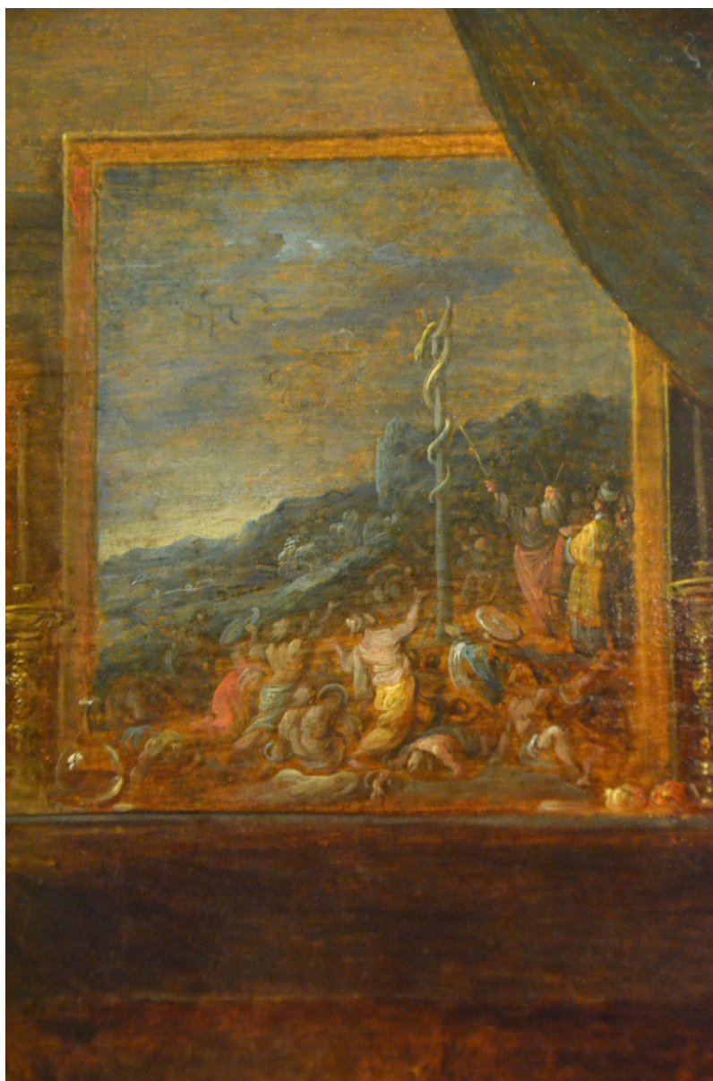
Figura 5. Frans Francken II, La incredulidad de santo Tomás , (detalle con la serpiente de metal).