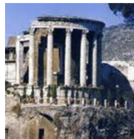
Figura 4. Templo de la Sibila de Tívoli en Roma.