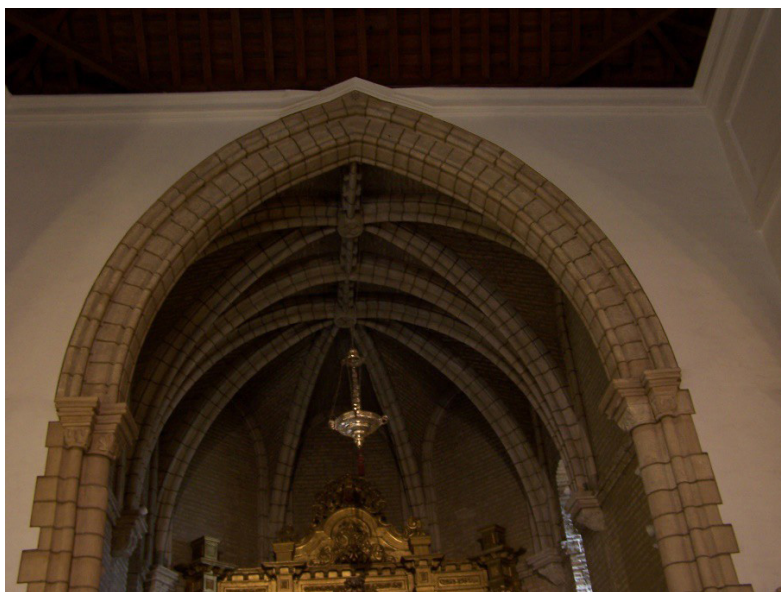
Figura 2. Iglesia de Nuestra Señora de la Estrella, Coria del Río (Sevilla). Ábside (Rafael Cómez).