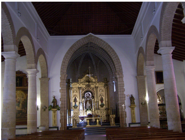
Figura 1. Iglesia de Nuestra Señora de la Estrella, Coria del Río (Sevilla). Interior (Rafael Cómez).