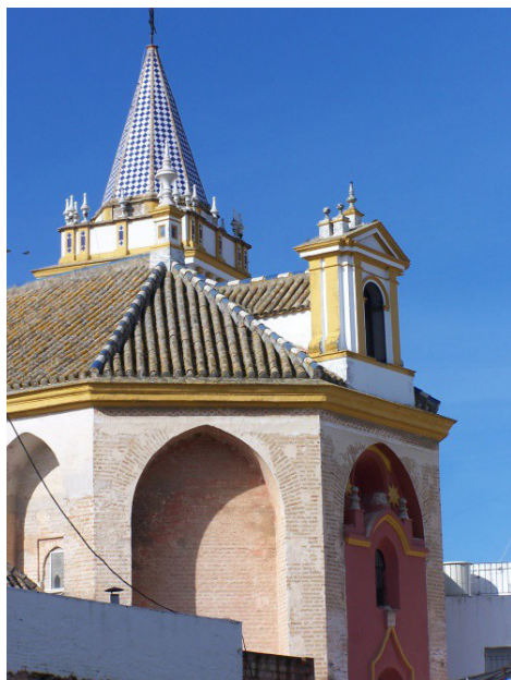
Figura 3. Iglesia de Nuestra Señora de la Estrella, Coria del Río (Sevilla). Exterior del ábside (Rafael Cómez).