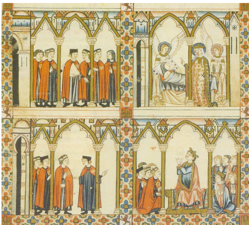
Figura 6. Cantiga 78: La Orden de Santa María de España (Cód. B.R. 20, f. 100, Biblioteca Nacional de Florencia).