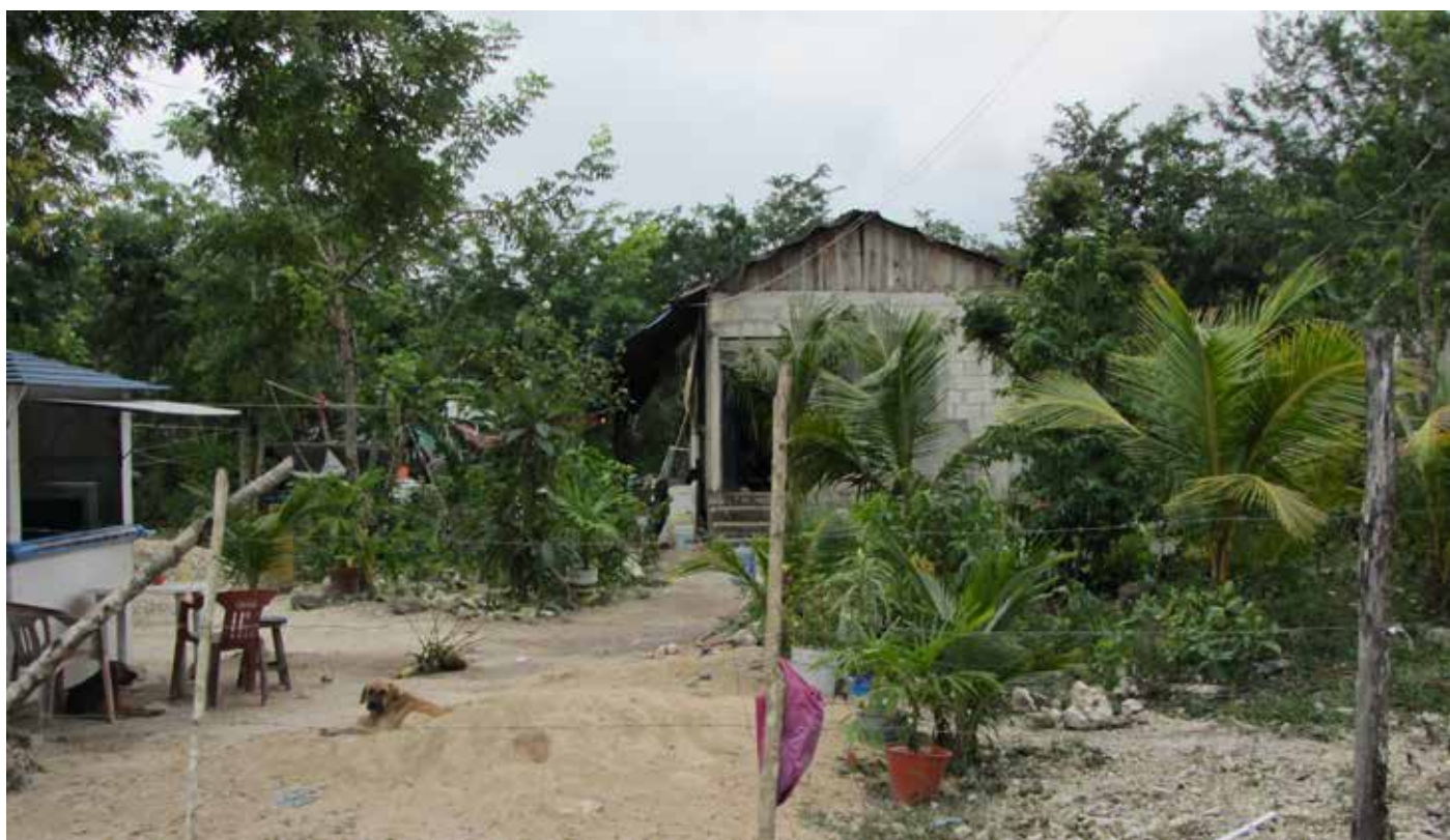
Figura 5. Nueva Generación (Cozumel).