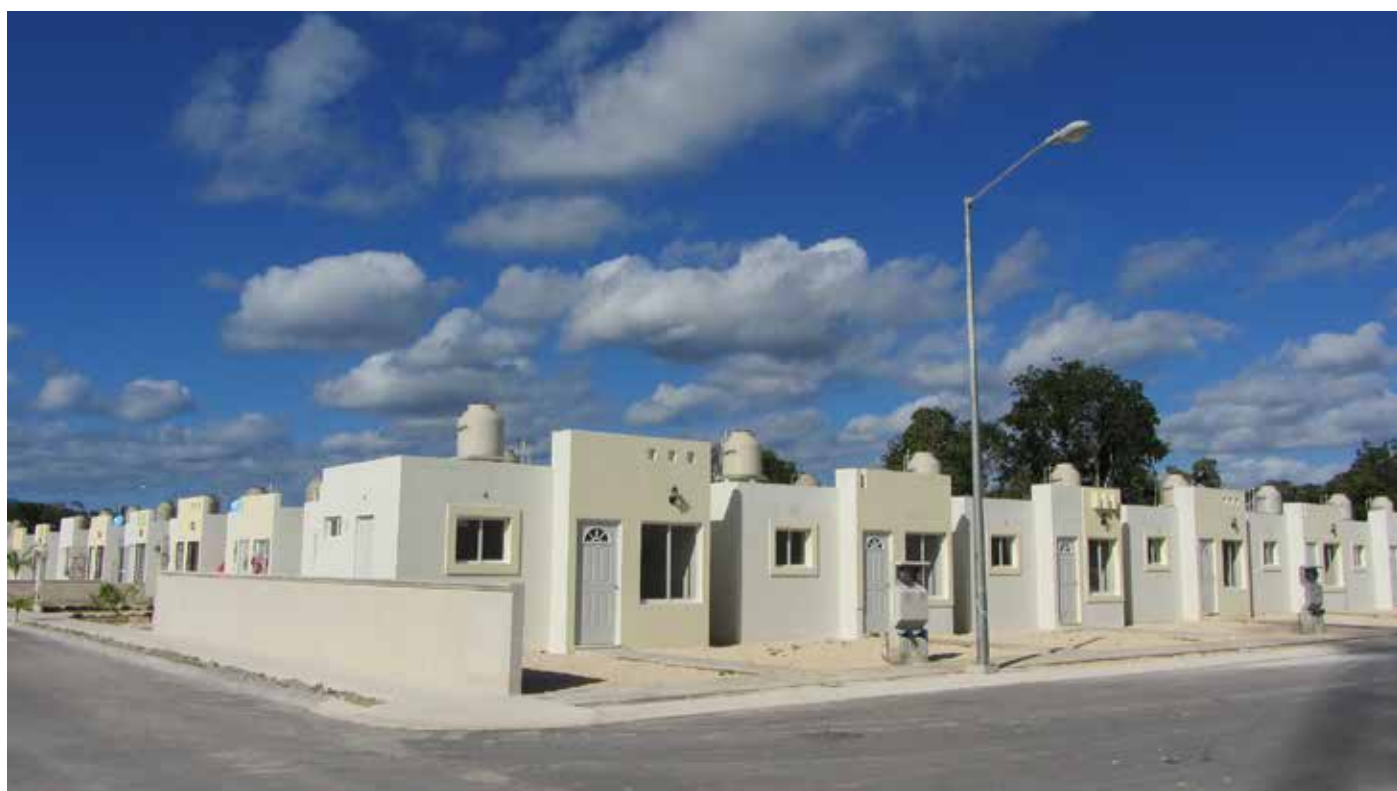
Figura 9. Guerra de Castas (Tulum).

En Cozumel, el tipo predominante en las intervenciones recientes es la vivienda unifamiliar, con escalas diferenciadas de respuestas,