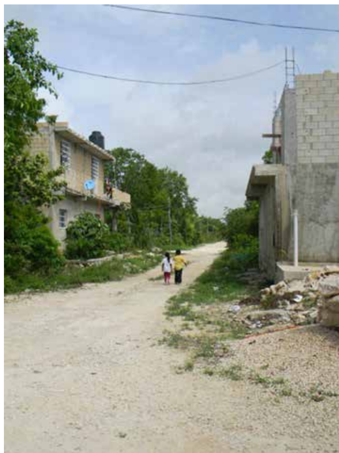
Figuras 7 y 8. San Gervasio (Cozumel).

Si bien la implantación residencial generada por las políticas públicas a manera de espacios habitacionales multiplicados en una homogénea periferia urbana indica, en términos generales, que el grado de inadecuación de los mencionados proyectos resulta evidente, cabe destacar, sin embargo, la presencia de la impronta cultural (popular) que se visualiza en las modificaciones exteriores realizadas a la vivienda, una vez que la misma es ocupada por sus habitantes: la aplicación de color, la definición de ciertos espacios intermedios, la presencia de jardines o pequeños espacios verdes en la vivienda, etc. Los mismos son verificables con mayor presencia en los casos donde tanto la antigüedad como la exigua definición proyectual resulta más evidente (ej., las viviendas en San Gervasio o las manifestaciones de autoconstrucción de Las Fincas o Cristo Rey). Las intervenciones sociales buscan reforzar las individualidades, destacar la presencia, a través de la diferenciación cromática, pero también recuperando esos “espacios intermedios” tan caros a la lógica local de definición residencial (ya sea como espacio verde y/o recreativo o como sitio que evidencia la idea de “vivienda productiva”) mexicana.