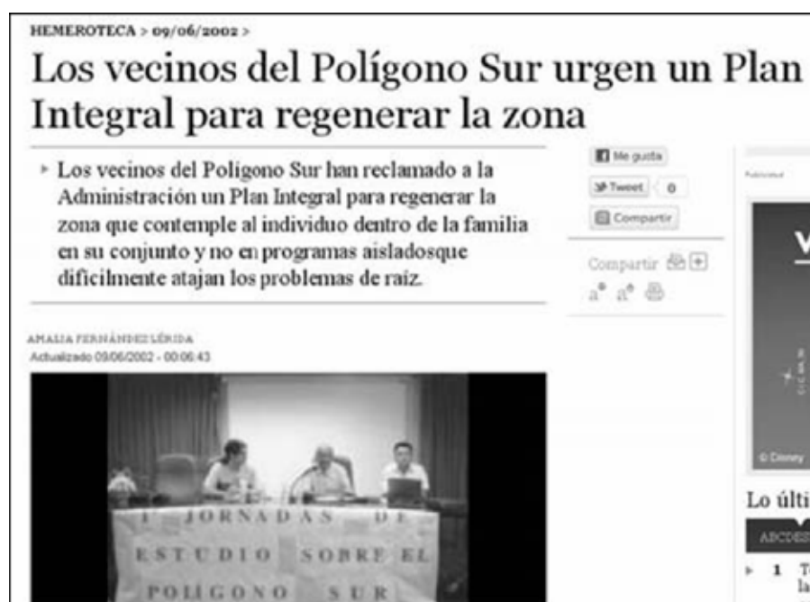
Figura 11. La demanda de nuevos modelos de gestión nace en la periferia social: es la iniciativa vecinal la que desencadenó el proceso que culminaría con el Plan Integral de Polígono Sur.