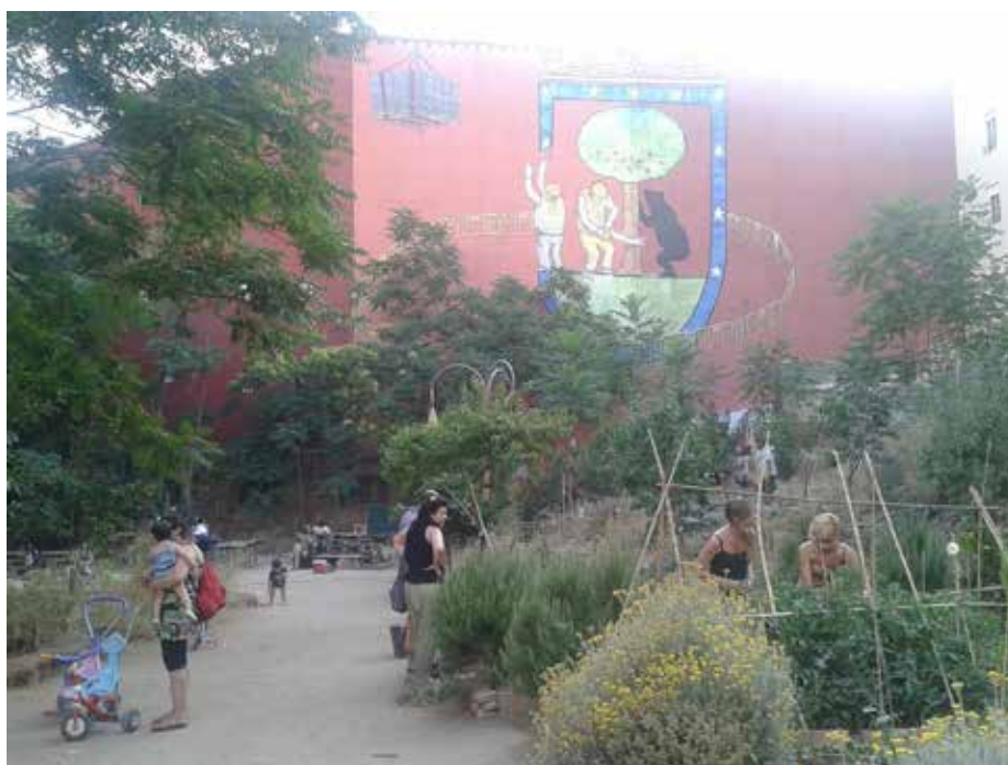
Figura 10. “Esto es una plaza”, en el barrio de Lavapies.

A partir de estas aproximaciones concluiremos sintetizando una serie de orientaciones, a modo de pistas conceptuales y metodológicas, que pueden resultar útiles para avanzar hacia la gestión sostenible de la ciudad y en particular para el tratamiento de las periferias urbanas: