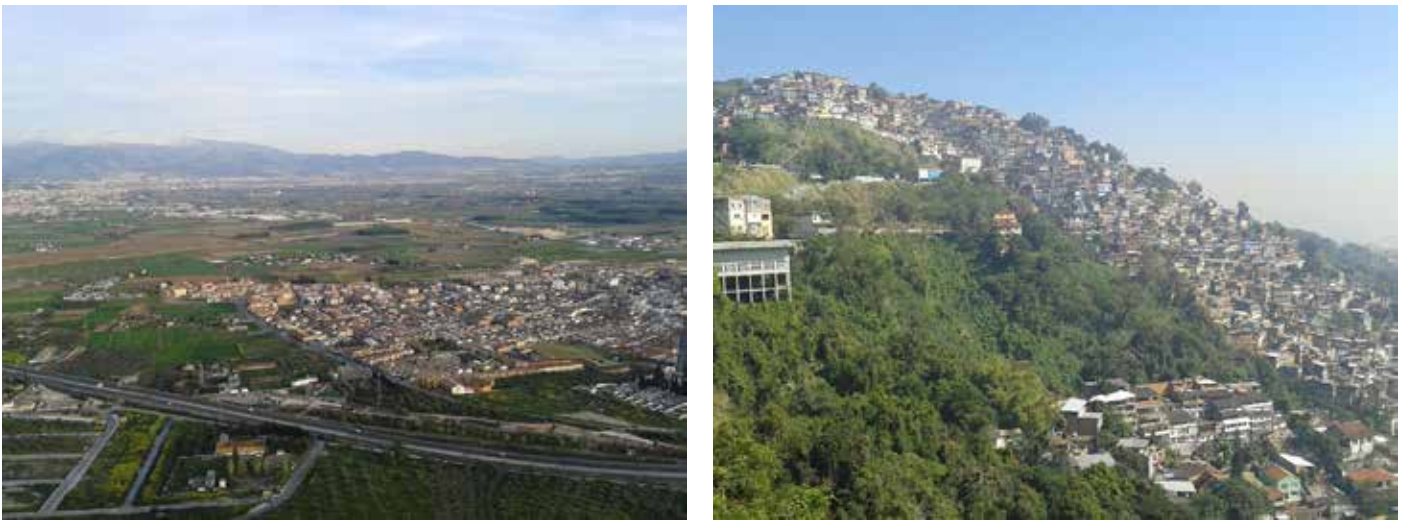
Figura 1. Distintas situaciones de periferia urbana. Área metropolitana de Granada, España (izquierda) y Río de Janeiro, Brasil (derecha).

Este texto se enmarca en el trabajo de la red “(des)Bordes urbanos. Política, gestión y proyecto en la ciudad de la periferia” (en adelante, dBU), encuadrada en el programa CYTED, 1 cuya convocatoria de 2011 puso el foco en el diagnóstico e intervención sobre las periferias urbanas (figura 1) en claves de sostenibilidad. Conforman la red varios grupos de perfil profesional y académico procedentes de distintas regiones de Iberoamérica, y nace con el propósito de compartir y generar conocimiento útil sobre el objeto de estudio: conceptos, instrumentos de análisis, aportes metodológicos y directrices de intervención.