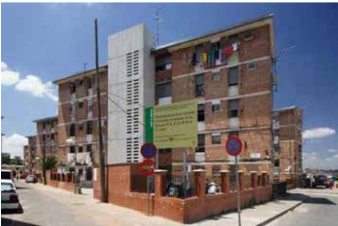
Figura 6. Rehabilitación del barrio San Martín de Porres (Córdoba).

Por último, en un sistema emergente puede haber factores de re-