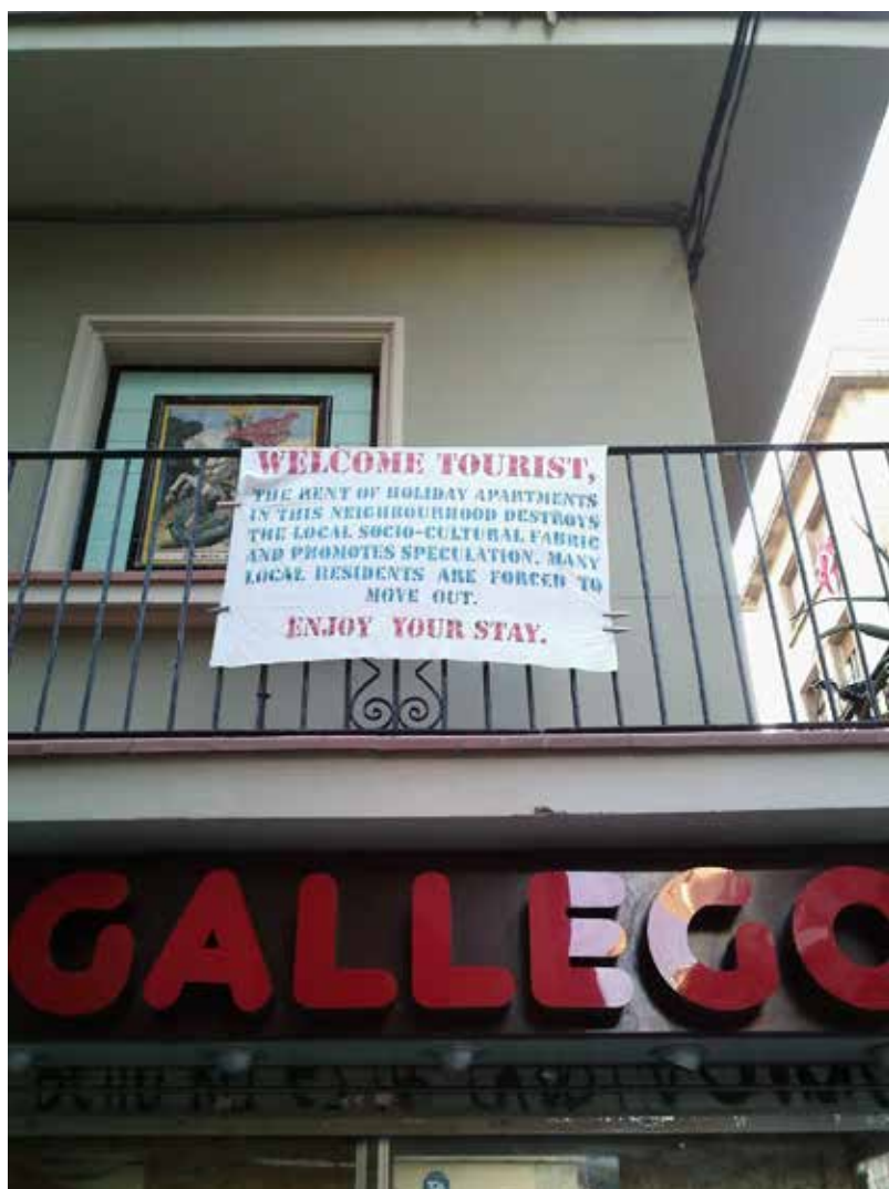
Figura 7. Cartel vecinal en la Barceloneta (Barcelona), que informa a los turistas sobre los efectos negativos de su presencia masiva en el barrio.

propuesta de la “bio-región” (Miller, 1999) como marco para la readaptación de la metrópolis al tamaño de su ecosistema de referencia, y más recientemente la ciudad de las aldeas (Magnaghi, 2011) o el concepto de autosuficiencia conectada (Requejo 2011a, 2011b). En la escala metropolitana cabe mencionar el constructo de Barrio-Ciudad (Hernández Aja, 1997), que nos insta a reformular la metrópoli desde un urbanismo de reforma interior y de base local. Estas posturas no implican la negación de la metrópoli sino un planteamiento transescalar e integral, dirigido a fomentar sociedades y economías de proximidad, y tendente a reubicar los sistemas urbanos en sus entornos bioregionales (Medina et al. , 2014b). En ese contexto, una gestión urbana orientada a la sostenibilidad ha de reconocer igualmente la necesidad de fijar límites a otros fenómenos de desborde urbano. Uno de ellos, como se ha mencionado, es el incremento desmedido de unos usos o funciones urbanas en detrimento de otras, como el turismo en los barrios históricos (figura 7); las tipologías de gran superficie comercial frente al pequeño comercio; el empleo masivo del automóvil privado frente a otros modos de movilidad; o las grandes extensiones residenciales suburbanas.