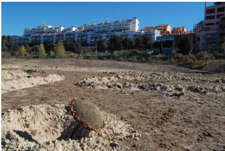
Figura 3. Medina Elvira Golf Resort (Atarfe, Granada), ejemplo extremo de la urbanización especulativa de hace una década: una promoción fallida de cientos de viviendas, sin ciudad y sin habitantes, levantada entre intersticios metropolitanos.

Desde los primeros debates de la red dBU se estableció la distinción entre una noción de periferia urbana definida en el sentido topológico o una periferia que se define por atributos (materiales, socioeconómicos o culturales) (Schelotto, 2013). En el contexto español, los ámbitos de borde hoy se corresponden con los espacios agrarios periurbanos y las áreas semiurbanizadas del borde metropolitano: lo que Fariña (2014) ha reconocido como el territorio correspondiente al “área de interfase entre la naturaleza protegida y la ciudad tradicional”, una zona fragmentada en conjuntos monofuncionales de urbanización dispersa entre terrenos baldíos ( figura 3 ), que se ha demostrado como un modelo altamente ineficiente y vulnerable a la crisis energética, lo que le augura un relevante papel como ámbito de acción política y actividad investigadora. 11