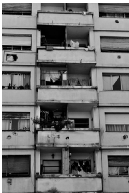
Figura 2. Deterioro y estigma de los viejos conjuntos habitacionales del siglo XX. Izquierda: Ciudad Evita (La Matanza, Buenos Aires). Derecha: Barriada Martínez Montañés (Polígono Sur, Sevilla).

La primera noción de periferia urbana aparece para aludir a los ámbitos semiurbanizados que a partir de la revolución industrial surgen entre la ciudad tradicional y el medio rural. 8 Es un concepto inherente al urbanismo como área de conocimiento y acción política, surgido en las últimas décadas del siglo XIX en respuesta a los conflictos y desafíos de la ciudad industrial (Hall, 1996). Es entonces cuando comienza a configurarse la idea de las periferias urbanas como áreas carentes, desordenadas y marginales. Esta noción de periferia se caracteriza a partir de las variables de distancia , dependencia y deficiencia en relación a un centro urbano (Arteaga, 2005, p. 101), una noción que aún conserva vigencia en el lenguaje técnico y el coloquial, debido a la posterior cronificación de muchos de estos sectores como ámbitos urbanos deficitarios. 9