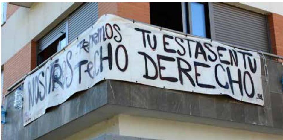
Figura 8. La Corrala Utopía, iniciativa pionera de ocupación en Andalucía.

res, junto a sus redes ciudadanas de apoyo, de ocupar colectivamente un edificio vacío propiedad de una entidad bancaria. Evidenciando las limitaciones de la adjudicación individual de viviendas, este caso abrió una puerta a la innovación política en materia habitacional a través de la construcción de modelos de cogestión basados en las oportunidades de una demanda estructurada (Habitares, 2014), un campo que es preciso explorar en relación con el parque de