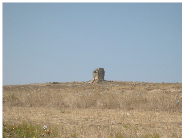
Fig. 6. El monumento de Ksar Rouhaha dominando el paisaje en el valle de Hédil, el antiguo Pagus Muxsi (Túnez).

los núcleos urbanos, en regiones de gran riqueza agrícola. Apenas tenemos constancia de la existencia de alguno de estos edificios en el entorno de la ciudad de Cartago, donde, como se ha visto a lo largo del trabajo, no debió ser tan necesario este tipo de representación y donde, muy posiblemente, el propio senado no dejó que se manifestasen de esa forma las emergentes clases sociales de corte aristocrático. En cambio, en el ámbito rural, sí era necesario ubicar este tipo de edificios con claras connotaciones simbólicas, religiosas e ideológicas tanto para controlar la mano de obra servil como para señalar los límites de la propiedad privada. Desde luego, la poca distinción social o étnica que observábamos en las necrópolis de una ciudad