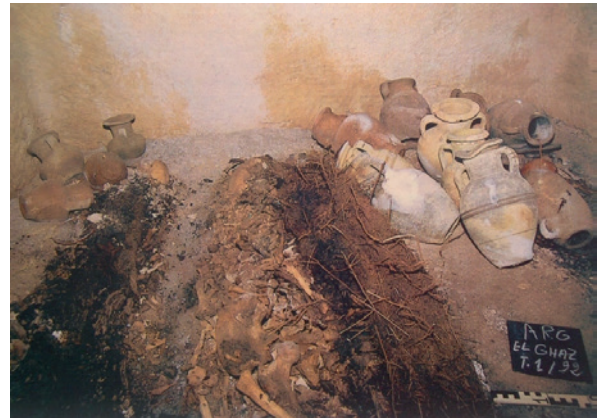
Fig. 4. Interior del hipogeo 1/92 de Arg el Ghazzouani. Contiene inhumaciones en sarcófago de madera y cremaciones ubicadas en urnas. Tumba fechada en el siglo IV a.C. (Fantar, 1998, 90)

destacan las ánforas de producción local, las clásicas cerámicas púnicas con decoración a bandas (jarras simples, de boca trilobulada y vasos) y los platos de pescado en barniz rojo y en barniz negro. También aparecen, aunque en menor porcentaje, algunas piezas importadas, fundamentalmente cerámicas áticas de figuras rojas con los habituales tipos usados en los espacios funerarios (olpes, leцитos y oinochoes).