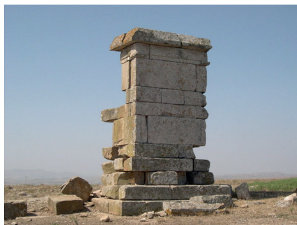
Fig. 5. Vista del monumento funerario de Ksar Chenane (Túnez)