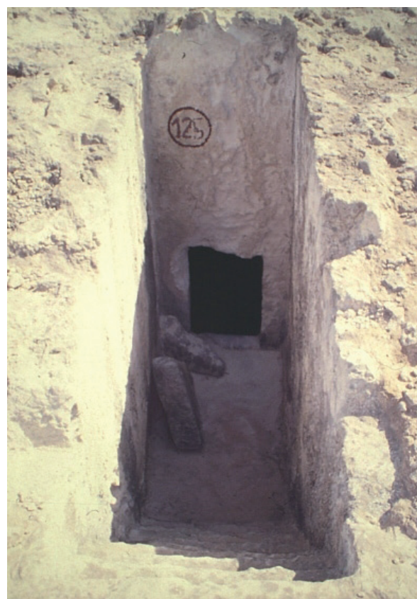
Fig. 2. Vista de uno de los hipogeos de la necrópolis de Arg el Ghazzouani (Kerkouane, Túnez)

A pesar de lo difuso de muchos de los datos obtenidos en el registro arqueológico púnico, éste supone, en muchas de las ocasiones y para el especial caso de Cartago, la única fuente de información con que se cuenta para conocer ciertos aspectos. Si nos detenemos de nuevo en la necrópolis púnica de Arg el-Ghazzouani (Fig. 2) podemos obtener algunos datos para