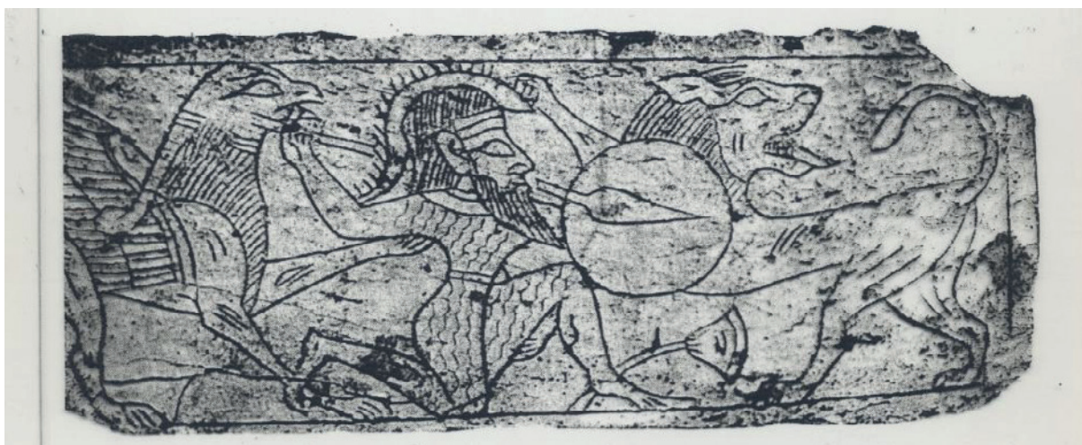
Fig. 1. Marfil de Bencarrón (Carmona, Sevilla). Representación de la figura de un león, grifo y un guerrero.