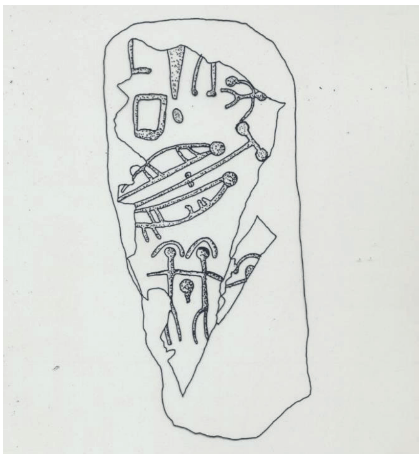
Fig. 2. Estela "Los Palacios". Procedente de Torres Alocaz (Sevilla). Representación de una pareja, que puede compararse a las figuras de gemelos de la tradición mítica de los indoeuropeos.