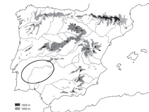
Figura 1: Marco de estudio. Situación de la Cuenca Media del Guadiana en la Península Ibérica.

A priori, parece que los yacimientos de cierto tamaño disponen asimismo de recintos delimitadores con fosos. Ahora bien, estas estructuras no se limitan en absoluto a los grandes poblados; además, en muchos asentamientos menores existe un carácter defensivo mucho mayor que en otros de mayor tamaño. Valgan la comparación entre Porto Torrão por un lado, y Monte