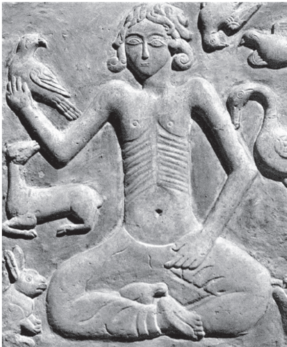
Lámina VII. Majnun en el desierto, en medio de los animales salvajes. Shiraz, Irán. Segunda mitad s. XVIII. (Fuente: Godard 1969).