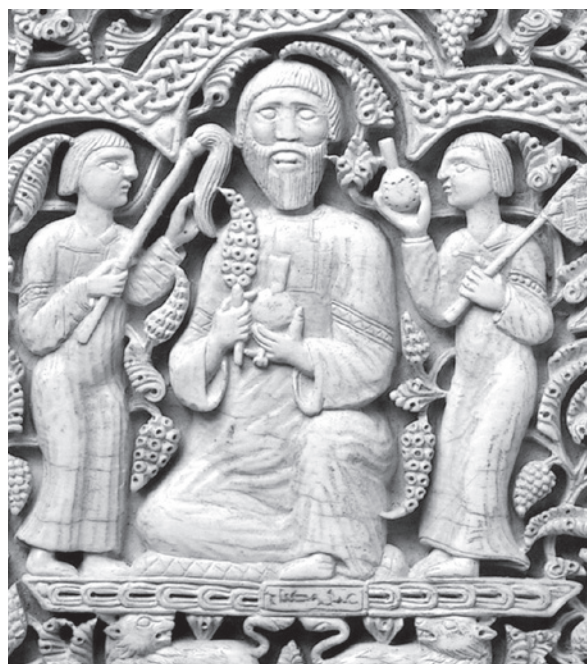
Lámina VI. Escena de uno de los medallones de la arqueta de Leyre. Museo de Navarra, Pamplona. 1004-5..

Por lo tanto, si comparamos la placa cordobesa con el conjunto de las imágenes expuestas podemos