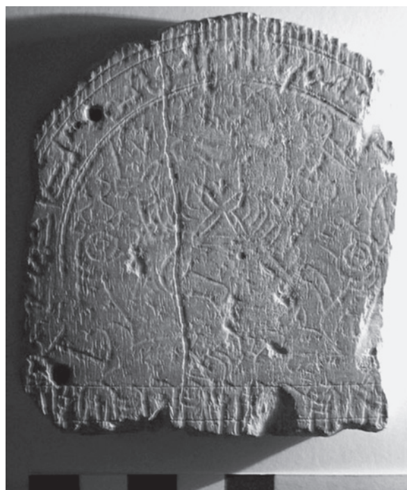
Lámina II. Placa cordobesa. Fotografía de la denominada cara 2.

presenten tal técnica, siendo éstos tallados en relieve, calados o pintados.