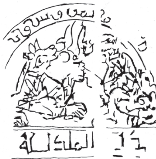
Figura 1. Placa cordobesa. Dibujo de la denominada cara 1.

dispone. Al exterior de este encuadre y dentro de una banda se encuentran dos inscripciones. La situada en la zona superior presenta una leyenda incompleta pero en la que se puede leer “...yumn wa surur...” o “...prosperidad y gozo...”. Esta inscripción está escrita en cúfico simple con una tendencia a alargar y curvar la terminación de los trazos de las letras “nun”, “waw” y “ra”. Como vemos se trata de una inscripción con carácter de eulogia para su poseedor.