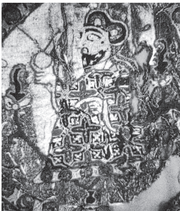
Lámina V. Representación de Mu'awiya sobre tejido. Colegiata de Oña, Burgos. Época califal.

califal de la colegiata de Oña (Burgos) (lám. V). Éste se encuentra sentado sobre un trono y sosteniendo una botella con su mano derecha. Bajo él hay otra jarra o botella de la que brotan dos ramas que acaban, en lo que identifica Zozaya como capullos de loto (Zozaya 2002: 124).