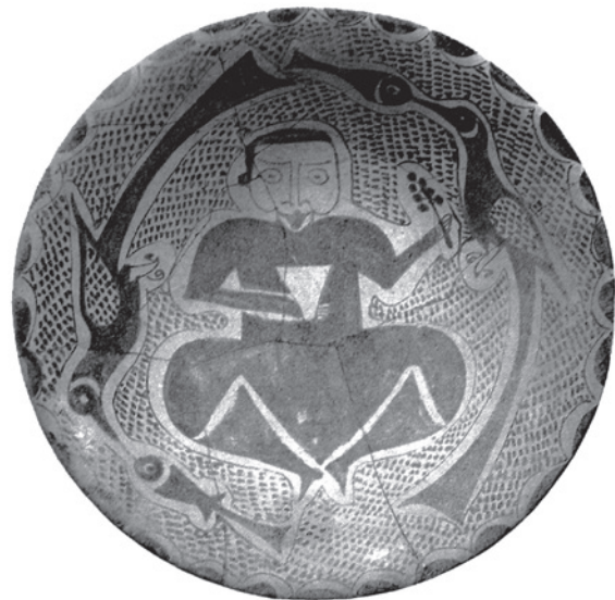
Lámina IV. Cuenco loza dorada. Irak. Siglo X. (Fuente: AA.VV. 1992).

Paraíso (Ewert 1991: 127). Enmarcándolo hay un friso compuesto de pájaros y peces.