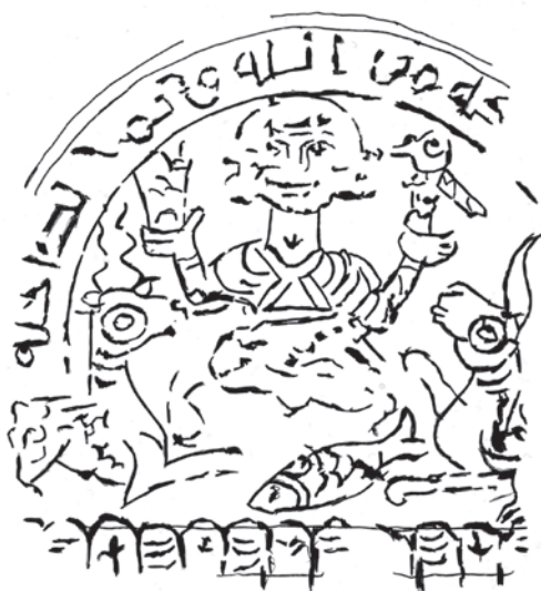
Figura 2. Placa cordobesa. Dibujo de la denominada cara 2 (Fuente: la autora).

En el centro de la composición figurada se sitúa una figura masculina sedente. Este personaje está sentado con las rodillas flexionadas sin ningún asiento donde apoyarse, por lo que parece estar flotando en el aire. Ambos brazos los mantiene levantados, sosteniendo con su mano derecha un vaso o copa y con su izquierda un pájaro. Presenta el peinado a modo de una melena,