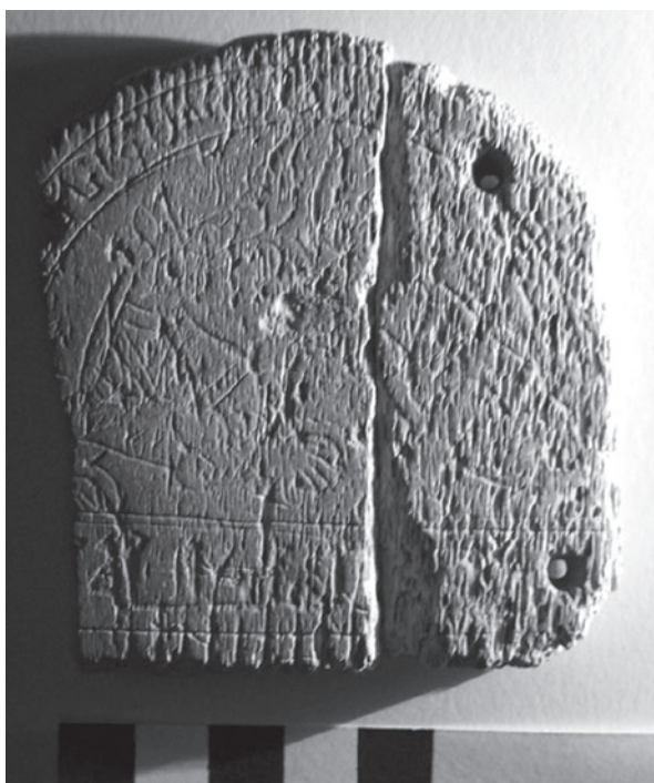
Lámina I. Placa cordobesa. Fotografía de la denominada cara 1.