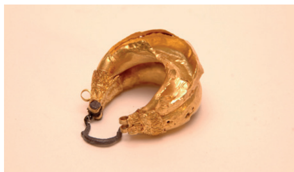
Lámina 5. Pendiente fusiforme doble de Mundo Nuevo, Museo de Málaga.

y pueden datarse en el siglo VI a. C., conforman tres parejas aun cuando una de ellas está incompleta. A pesar de su similitud, pues en todos los casos se trata de pendientes fusiformes dobles, no dejan de mostrar ciertas diferencias interesantes. Así, el pendiente único –nº. inv. 13.253– (lám. 5), tiene unas dimensiones de 35x30 mm., y está formado a partir de una sola lámina hueca de tendencia fusiforme con un pequeño cierre de bronce que termina en dos pequeñas barritas que entran en sendas arandelas de oro (Martín et alii 2003: 147). Otras dos arandelas situadas en los extremos superiores denotan que este pendiente debía portar elementos de suspensión que no se han conservado, similares muy posiblemente a otras piezas conocidas en puntos como