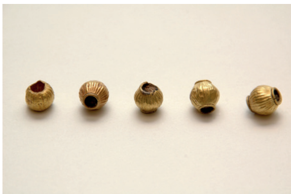
Lámina 1. Cuentas de collar de calle Zamorano, Museo de Málaga.

los hallazgos cartagineses (Quillard 1979: 110), presentes también en tumbas de Villaricos (Astruc 1951: lám.XV).