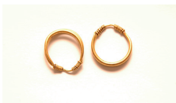
Lámina 8. Pareja de pendientes de calle Zamorano, Museo de Málaga

escudero portasandalias, mientras que en la otra cara del medallón vemos el árbol sagrado entre dos cabras rampantes que trepan por él (Sánchez 1974: 77; Blázquez 1975: 144-146).