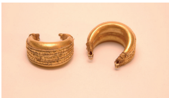
Lámina 6. Pareja de pendientes fusiformes dobles de Mundo Nuevo, Museo de Málaga.