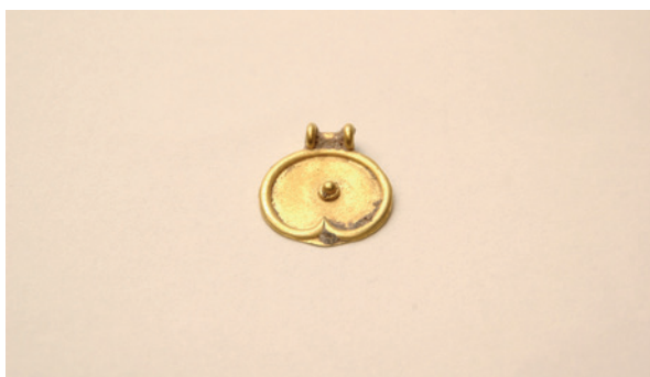
Lámina 3. Cuentas y colgante-medallón de uno de los collares de calle Zamorano, Museo de Málaga.