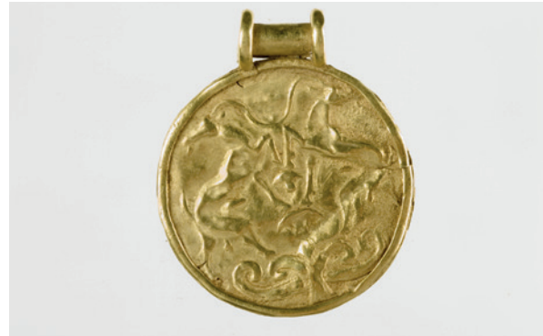
Lámina 10. Reverso del medallón anterior, Museo Arqueológico Nacional.

documentar es la del granulado, también con un origen en el Mediterráneo oriental y en la que pequeños gránulos de oro son soldados a una lámina (Bandera 1986: 529-530), como puede apreciarse en el ónfalos del colgante en forma de corazón de calle Zamorano.