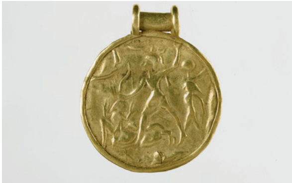
Lámina 9. Anverso del medallón de la colección Vives, Museo Arqueológico Nacional