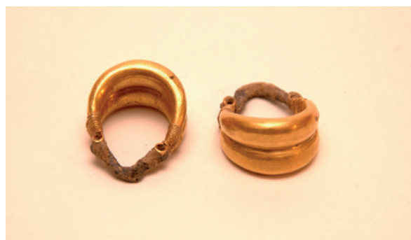
Lámina 7. Pareja de pendientes fusiformes dobles de Mundo Nuevo, Museo de Málaga.

IVaA de Perea (1986: 298 y 311), es decir, pendientes cerrados simples, lo que no excluye que también pudieran haber sido empleados como nezem o adornos nasales según ponen de manifiesto las terracotas ibicencas (Perea 1985: 39; 1986: 63). Su confección se realiza a partir de un hilo de oro que es cerrado en su extremo enrollándose sobre sí mismo, pudiendo citarse piezas similares en tumbas de Cádiz (Perea 1986: 298-299), Villaricos (Astruc 1951: láms. XV, XX, XLI) y Puig des Molins (Fernández 1992: 185-187).