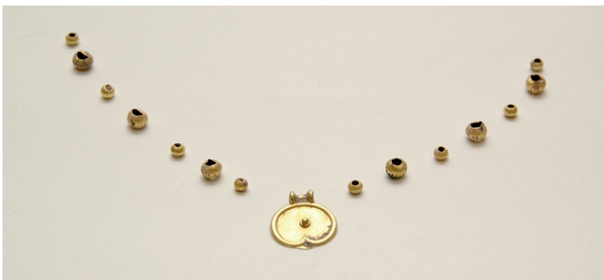
Lámina 2. Colgante-medallón de calle Zamorano, Museo de Málaga

Todos los pendientes de Mundo Nuevo, que podemos incluir en el grupo III.3.C de M. J. Almagro (1986: 34)