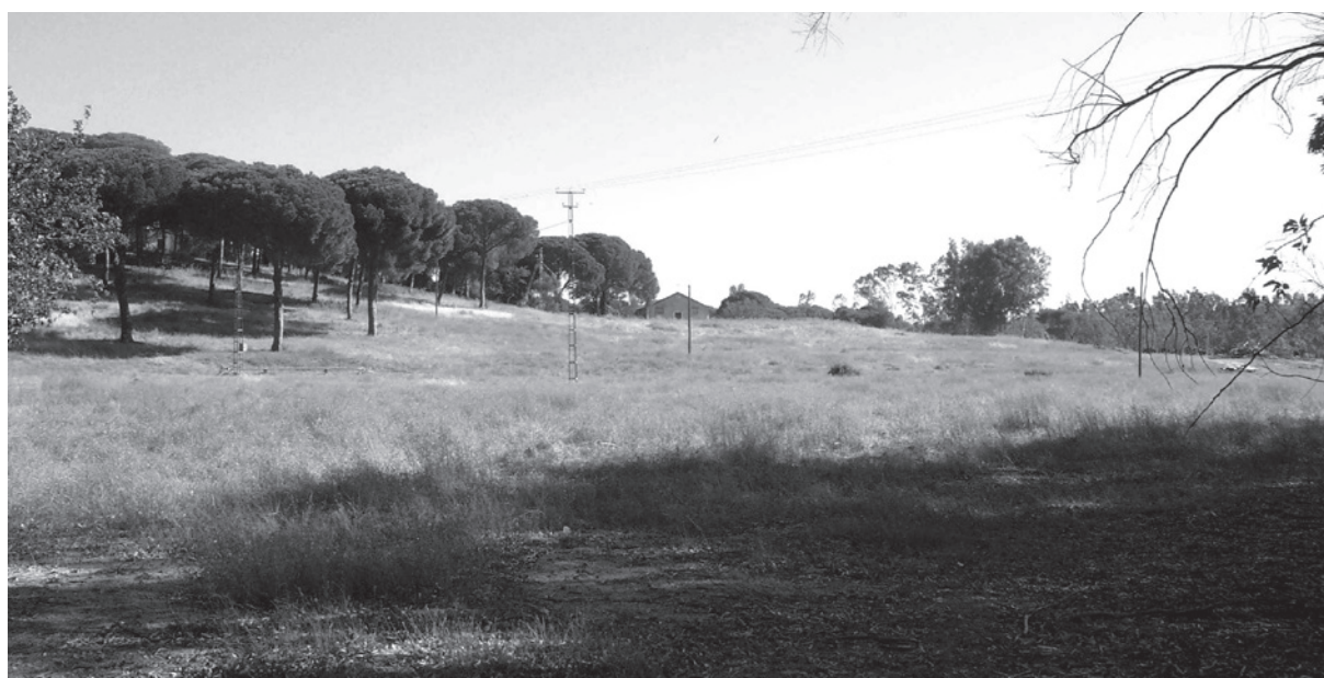
Figura 5. Fotografía del lugar exacto del hallazgo de la pieza

Como muy bien observaron Salas y Mesa (1996: 156-157), la distribución espacial del poblamiento romano de esta zona se encuentra por encima de los 10m sobre el nivel del mar, estando los yacimientos de carácter funerario separados de los asentamientos en zonas de posibles inundaciones en momento de subidas del nivel de las marismas. Estando toda la zona subordinada por la importancia de los cercanos núcleos de Caura , Hispalis y Orippe , que conforman un triángulo de ciudades portuarias en la desembocadura del Guadalquivir.