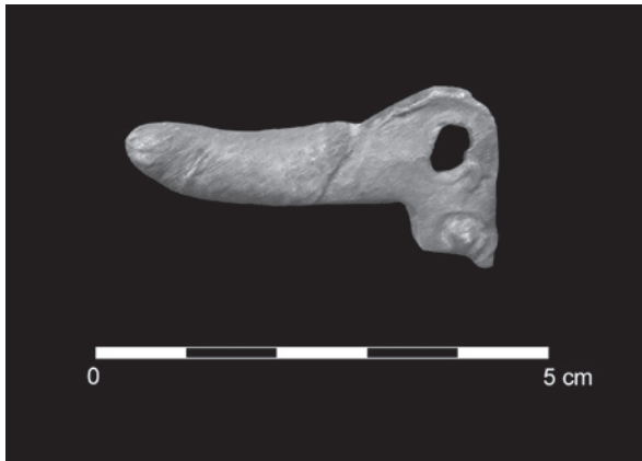
Figura 1. Amuleto fálico.