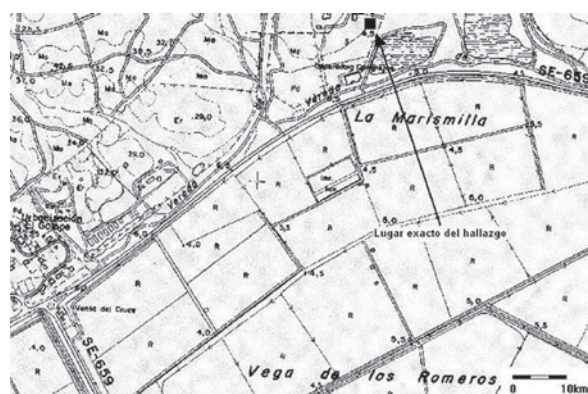
Figura 4. Plano de situación a escala 1:10000 de la zona del hallazgo del amuleto

Desde época de Trajano se produjo el final de la expansión territorial y, con ella, de la producción de excedentes, a lo cual habría que unir el aumento progresivo de la presión impositiva, que disminuiría la cantidad de excedentes comercializables, causas todas ellas que desembocaron en una regresión definitiva del comercio interprovincial. Todo ello propició el reforzamiento de los grupos económicos más poderosos frente a los grupos de medianos y pequeños propietarios, de tal forma que los poderosos hicieron sentir su predominio sobre el campo, dinámica que se acentuó durante el s. III d. C., produciéndose una disminución del volumen del comercio exterior, que se dejó ver en la interrupción de las exportaciones del