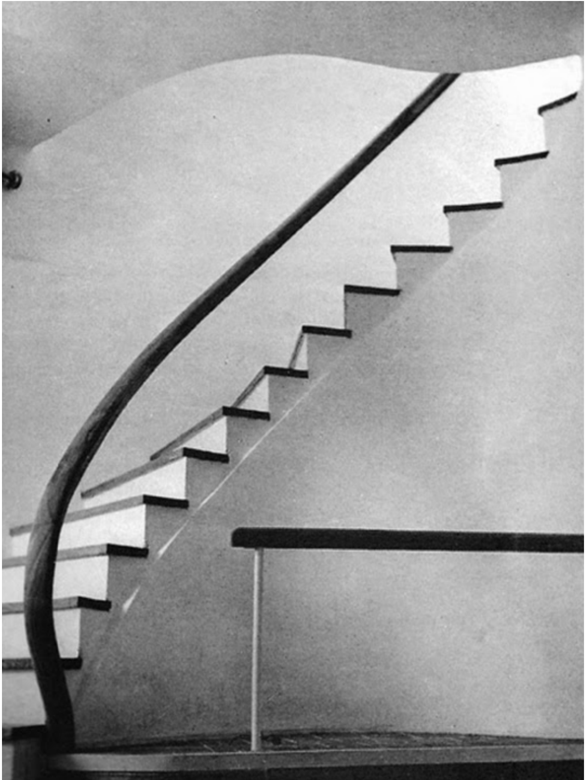
Interior Casa Arvesú, Madrid. Arqto. Alejandro de la Sota, construida en 1955, demolida en 1987.