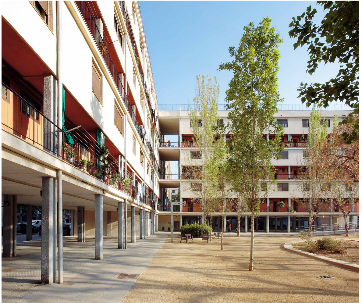
Imagen 7: Josep Lluís Sert, Josep Torres Clavé y Joan Baptista Subirana, Casa Bloc, Barcelona. Intervención a cargo de Víctor Seguí.

En lo relativo a la materialidad y a la recuperación formal de la arquitectura moderna, es necesario recordar la obra de des-restauración practicada por Juan Antonio Martín Trenor en 1983 sobre el emblemático Pabellón del Rincón de Goya en Zaragoza. Considerada obra fundacional del Movimiento Moderno en nuestro país, la actuación de Martín Trenor generó una importante controversia, que afectó a planteamientos más generales sobre la autenticidad en la restauración monumental en España 15 .