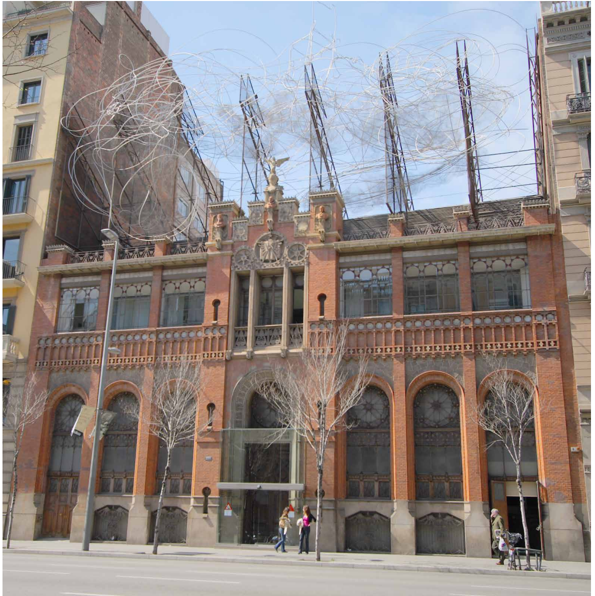
Imagen 2. Lluís Domènech i Montaner, edificio de la editorial Montaner i Simó, Barcelona. Intervención a cargo de Óscar Tusquets y Lluís Clotet.