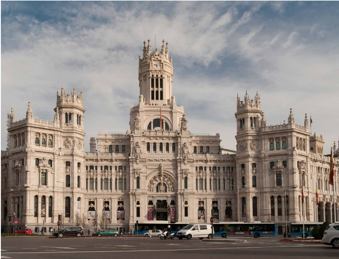
Imagen 3: Antonio Palacios Ramilo, Palacio de Comunicaciones de Madrid. Intervención a cargo de Francisco Rodríguez de Partearroyo.

Estas intervenciones en la arquitectura más reconocida por su valor mediático e icónico a lo largo de los años ochenta e inicio de los noventa, han ofrecido un prolijo campo de ensayos en el que posteriormente se ha fundamentado el debate sobre la intervención patrimonial en la arquitectura del Movimiento Moderno, que cobró especial fuerza en España tras el inicio de las actividades de la Fundación DoCoMoMo Ibérico en 1993.