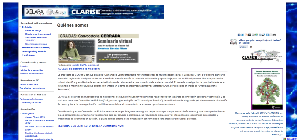
Figura 4. Portal de CLARISE ( https://sites.google.com/site/redclarise/ )

han venido integrando a la red varios participantes de otros países Latinoamericanos, del Caribe y de Europa (ver portal del sitio en Figura 4).