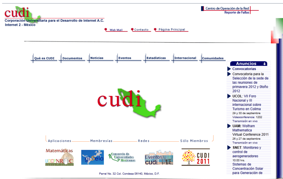
Figura 3. Portal de CUDI ( http://www.cudi.edu.mx/ )

El contexto de este caso se presenta en una red mexicana de investigación educativa: Corporación de Universidades para el Desarrollo de Internet (CUDI http://www.cudi.edu.mx/ ). CUDI fue fundada en 1999 y es una asociación civil sin fines de lucro que gestiona la Red Nacional de Educación e Investigación para promover el desarrollo de nuestro país y aumentar la sinergia entre sus integrantes. En CUDI se busca impulsar el desarrollo de aplicaciones que utilicen la red nacional para fomentar la colaboración en proyectos de investigación y educación entre sus miembros (ver portal del sitio en Figura 3).