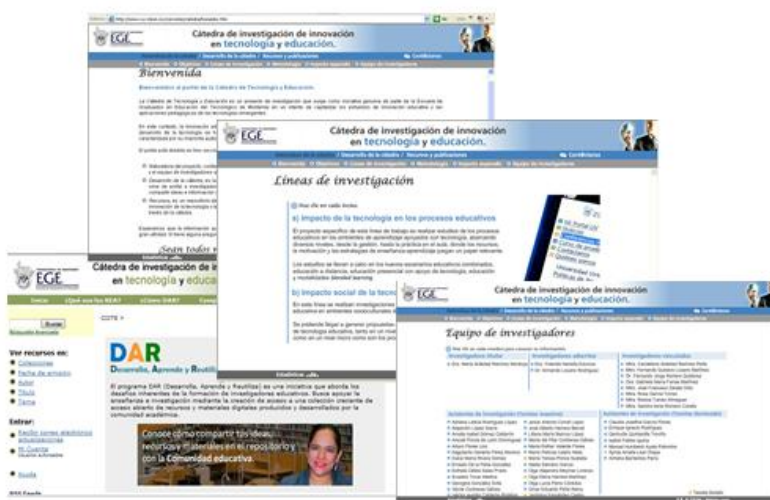
Figura 2. Portal de CIITE ( http://www.ruv.itesm.mx/convenio/catedra )

La característica de este caso es que se parte de una línea de investigación de un profesor titular y se integran otros profesores para formar estudiantes, para trabajar integrados en la temática (simulando un efecto “cascada”), por medio de procesos a distancia.