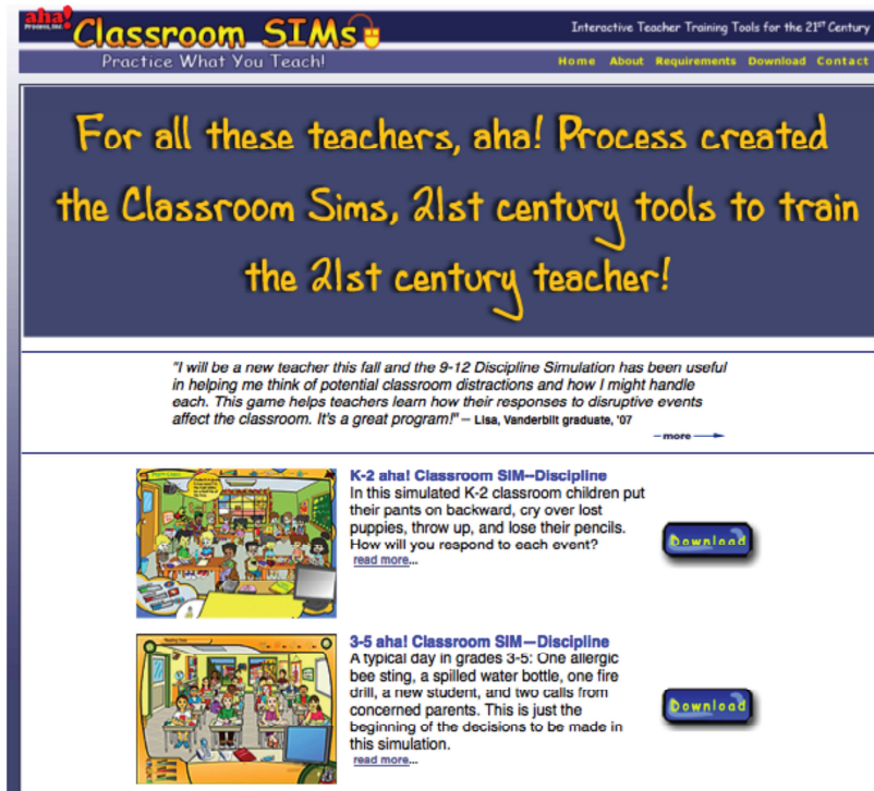
Figura 4 - Classroom SIM

En el marco del Programa Internet en el Aula, la entidad pública Red.es también ha desarrollado un simulador para docentes.