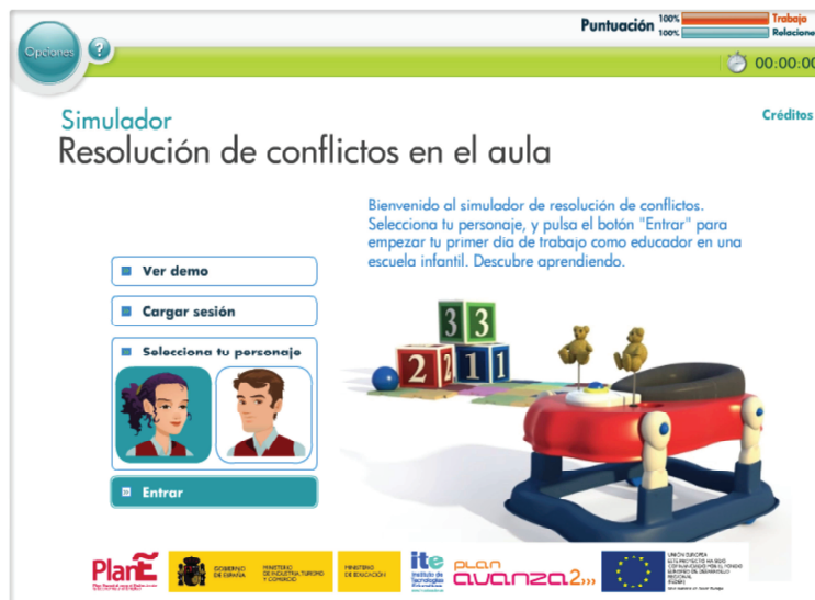
Figura 5 - Simulador del aula

En este caso se aborda la resolución de conflictos en el contexto del aula.