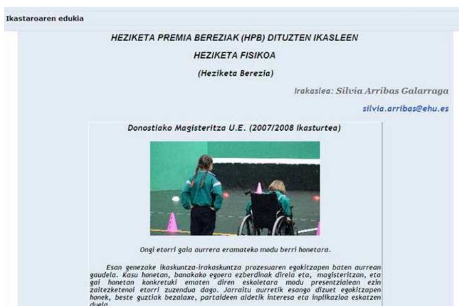
Imagen 2: Pagina de acceso al curso

Al entrar en el curso, como hemos comentado anteriormente, aparece la presentación del mismo.