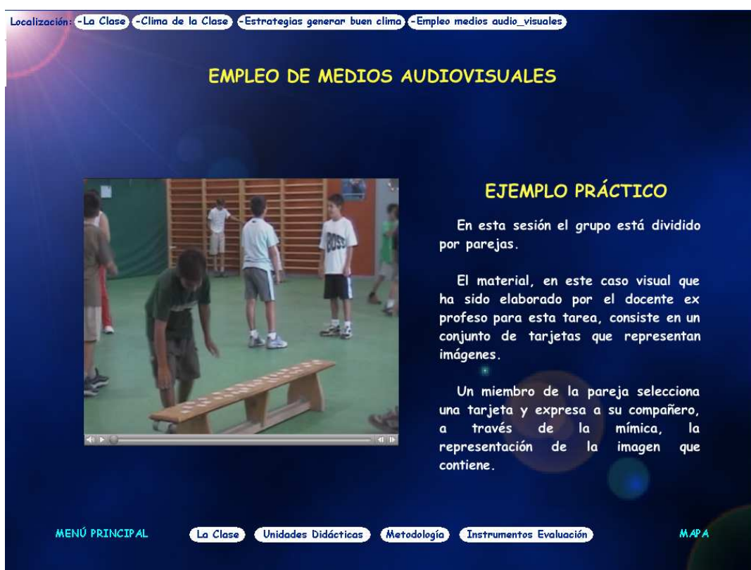
Ilustración 2.- Ejemplo práctico sobre “Empleo de medios audiovisuales”, del subapartado de “Estrategias para generar un buen clima de clase”, perteneciente a la dimensión “La clase”