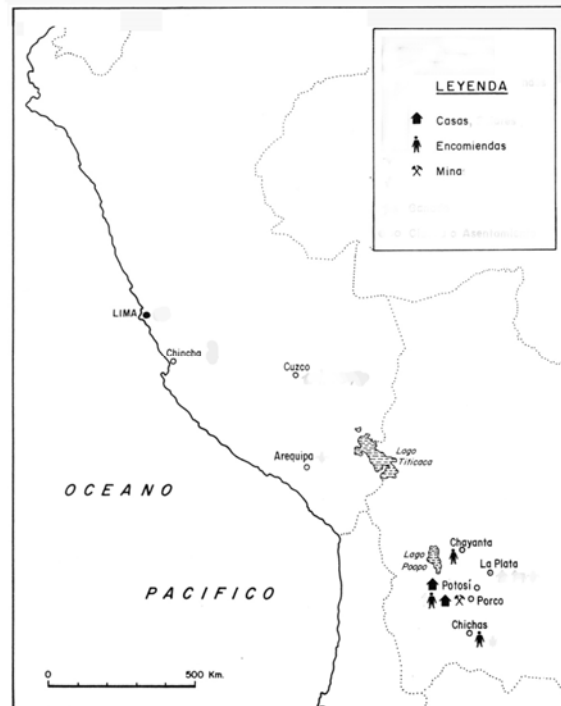
Foto 2. Mapa de situación de los territorios administrados por Baltasar Velázquez.