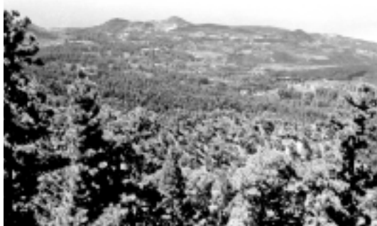
Panorámica del municipio de Garafía desde la cumbre.

se incluyen elementos únicos en toda la isla, muchos de los cuales tendrían su origen en la época prehistórica. En este sentido, debemos tener en cuenta que tal vez fuera esa la causa de la enorme proliferación de manifestaciones rupestres en esta zona en comparación con otros territorios palmeros en los que esta pauta cultural tuvo menor repercusión.