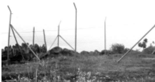
Estación de El Cercado (Santo Domingo), recientemente protegida.

En relación con lo dicho anteriormente, sabemos que esta estación, situada en el borde de una huerta, constaba de al menos unos ocho paneles en los que predominan fundamentalmente los meandros y las espirales. Y decimos "constaba" debido a que uno de los bloques grabados se encuentra actualmente expuesto