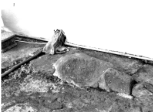
Petroglifo formando parte del suelo de un patio (Casa de Santiago, Garafía).

En la vivienda que se ubica a la izquierda del molino de El Calvario, supimos casualmente de la existencia de dos pequeños bloques grabados. Uno de ellos forma parte del patio, ya que está unido con cemento al empedrado del suelo. El otro grabado corresponde a un bloque suelto que este vecino guarda en su casa. Según nos informó el vecino, la procedencia de estos grabados son los muros de las huertas situadas en las cercanías.