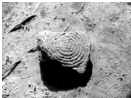
Pequeño petroglifo procedente de Garafia y depositado en el Museo Insular (Santa Cruz de La Palma).

Esta estación aparece recogida en el Corpus de Grabados Rupestres de la Palma 13 , pero nosotros no hemos tenido ocasión de verla. Según consta en el mismo, donde aparece citada bajo el epígrafe de “La Castellana”, se trata de un bloque de basalto de medianas dimensiones que se haya depositado en el patio de la casa de la familia Pedrianez, cerca de La Castellana. Los motivos representados son una espiral con cambio de sentido interno y asociada a un meandriforme.