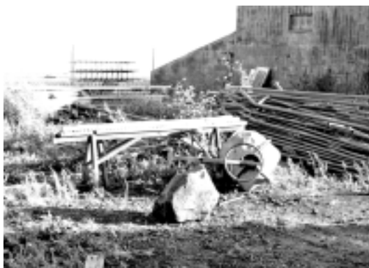
Bloque grabado localizado en las proximidades del Ayto. de Garafía (Santo Domingo).

Este petroglifo fue hallado de forma casual en julio de 2000 durante los trabajos de acondicionamiento de una pared llevados a cabo justo enfrente del ayuntamiento. El soporte era un bloque basáltico de mediano tamaño, en una de cuyas caras se grabó una pequeña espiral culminada en meandro. Tras ser retirado de entre los escombros, fue depositado junto a las naves municipales situadas a unos 300 metros del lugar del hallazgo. Allí permanecía cuando nosotros acudimos a estudiarlo casi un mes más tarde, desconociendo actualmente cual es su emplazamiento.