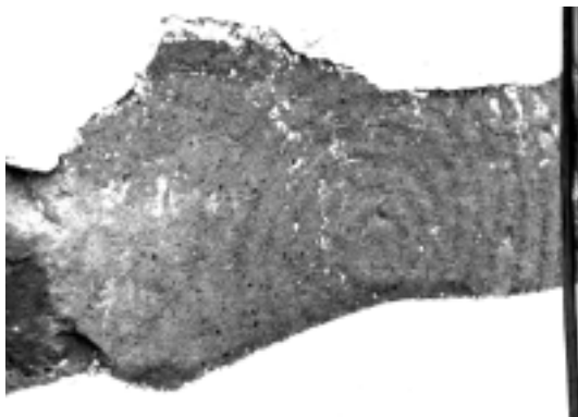
Bloque con espiral que forma parte de la pared de la Casa del Baile (San Antonio del Monte).