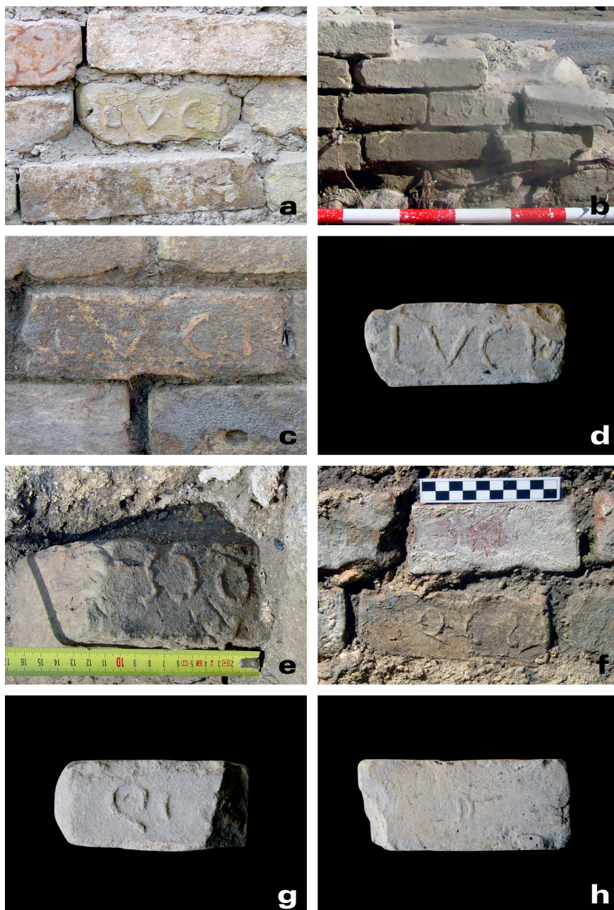
Figura 1. Sellos sobre ladrillo.