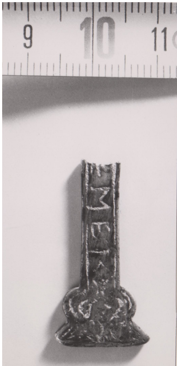
Figura 1. Nuestra Cruz de Caravaca procedente del Cerro de las Pozas (Doña Mencía, Córdoba). Foto: CIL II 2 /5, 344.