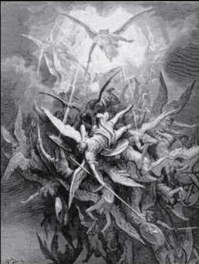
Fig. 5: La caída de los ángeles rebeldes del Paraíso perdido de John Milton. París, 1867.