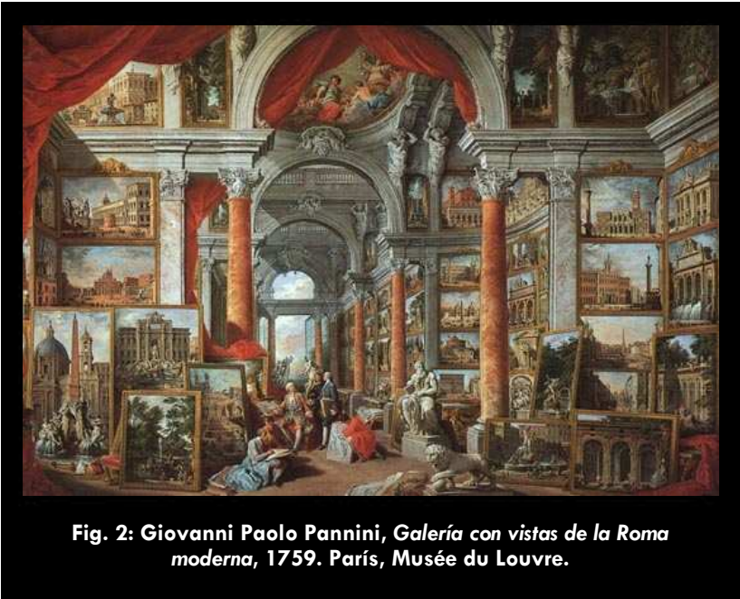
Fig. 2: Giovanni Paolo Pannini, Galería con vistas de la Roma moderna , 1759. París, Musée du Louvre.