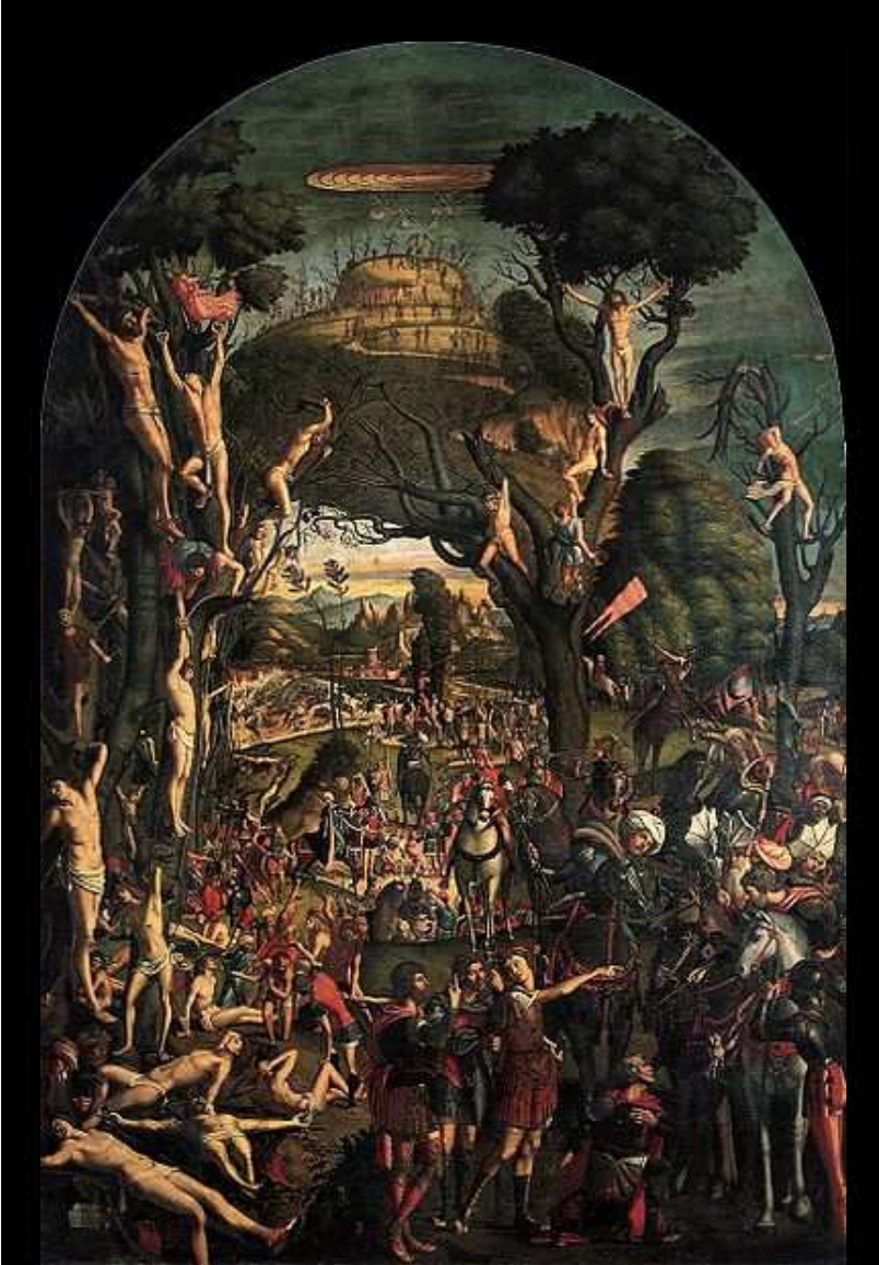
Fig. 4: Vittore Carpaccio, Crucifixión y apoteosis de los diez mil mártires del monte Ararat , 1515. Venecia, Gallerie dell'Accademia.