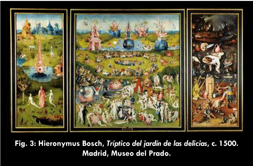
Fig. 3: Hieronymus Bosch, Tríptico del jardín de las delicias , c. 1500. Madrid, Museo del Prado.