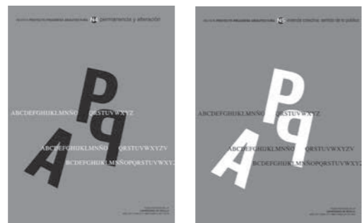
PPA N04 PPA N05

PPA N01. EL ESPACIO Y LA ENSEÑANZA DE LA ARQUITECTURA. (Año I, mayo, 2010) PPA N02. SUPERPOSICIONES AL TERRITORIO. (Año I, mayo 2010) PPA N03. VIAJES Y TRASLACIONES (año I, noviembre 2010) PPA N04. PERMANENCIA Y ALTERACIÓN. (Año II, mayo 2011) PPA N05. VIVIENDA COLECTIVA: SENTIDO DE LO PÚBLICO. (Año II, noviembre 2011)