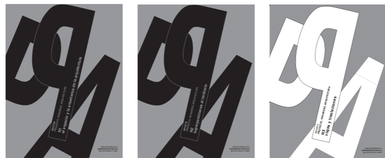
PPA N01 PPA N02 PPA N03