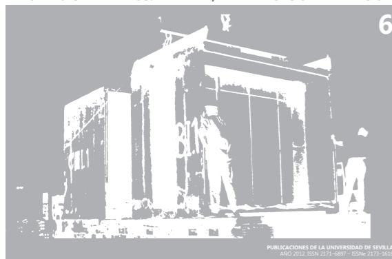
PPA N06. MONTAJES HABITADOS: VIVIENDA, PREFABRICACIÓN E INTENCIÓN. (AÑO III, mayo 2012)