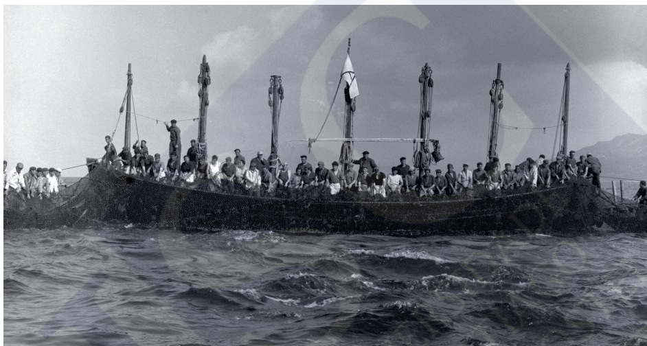
Sacada de la almadraba de Los Lances (Tarifa), hacia finales de los años sesenta

La almadraba de Tarifa resultaba rentable debido a la existencia de una instalación fabril, y a que sus atunes son de más peso –característica que atribuyen los almadrabetos a su procedencia norteafricana–. Y la actividad de La Atunara, exclusivamente de revés, se explica por los buenos resultados en bacoretas, bonitos y, sobre todo, melvas. En una fecha tan tardía como 1956 levantó instalaciones el CNA en esta localidad.