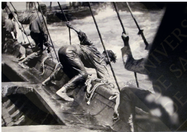
Marinero copejeando un atún, Almadraba Las Cabezas (Isla Cristina, Huelva), 1930.

draberos respecto a las vernáculas prácticas de aprovechamiento de las partes sobrantes de los atunes. Históricamente, la retribución en los sitios almadraberos había combinado el sistema de jornales, regalías y el de participaciones de partes o subproductos del atún, así como distribución de “pescado chico” (melvas, atuarros, bonitos, voladores, etc.). Fomentado por la organización empresarial dominante desde la capitalización de la pesquería, a lo largo del siglo XIX, la norma fue mantener los jornales bajos y promover repartos sobre las capturas, bien de atunes, bien de especies accesorias, de modo que los jornaleros se sintieran corresponsables de la productividad del negocio, favoreciendo el destajo. En las nuevas colonias industriales, surgidas a pie de almadraba desde fines del XIX, perviven antiguas prácticas de apropiación de una pequeña parte de la pesca por los trabajadores, que tendrán continuidad en el s. XX. Como un rastro de prácticas características de una economía moral o de prestigio (Florido, 2007), también las empresas permitían que los trabajadores se hicieran con partes no aprovechables para su tratamiento en conservas (ojos, oídos, faceras, restos de espinazo, estómago, etc.). 17 Desde las empresas