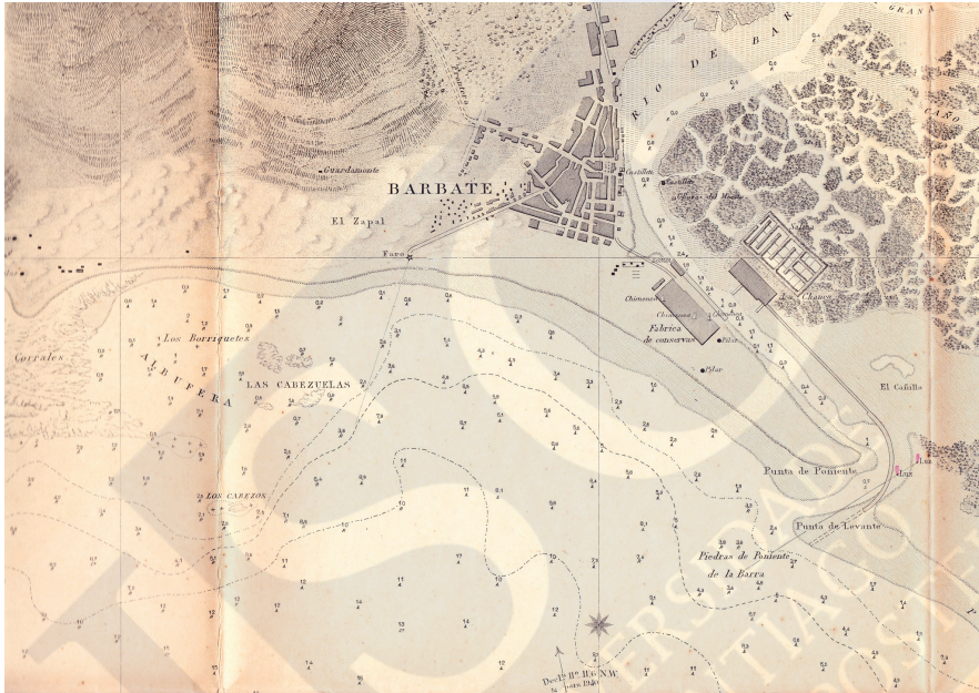
Plano de Barbate, hacia 1930

fabriles relacionadas con el atún desde principios de siglo, 11 y no en la zona exterior, más al oeste, donde finalmente hubo de construirse apenas veinte años después.