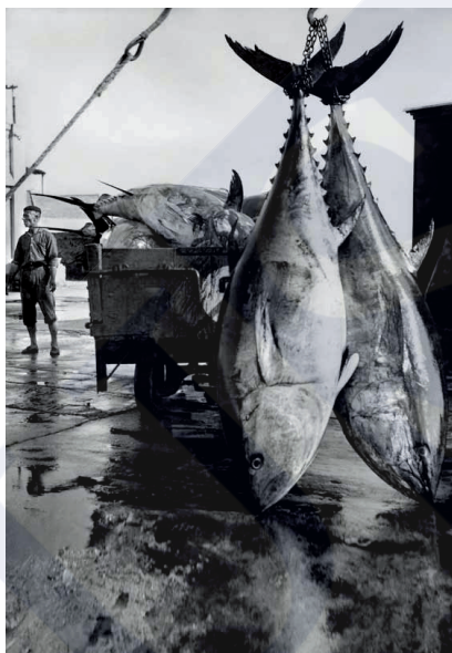
Transporte de atunes en el muelle del puerto fluvial de Barbate, 1957.

El reglamento del CNA de diciembre de 1928 generó una importante campaña de protesta, en ámbitos políticos y mediáticos. Esta fue resultado de tres grandes factores: i) la limitación de la libertad de acción de otras modalidades pesqueras móviles, al ser privilegiadas las almadrabas; ii) las consecuencias que la concesión monopolista tuvo sobre empresas de industrialización de túnidos y especies afines (especialmente en Huelva); y iii) las condiciones laborales que quedaron sancionadas en el nuevo período. Empresarios expulsados del nuevo régimen y representantes sindicales, por tanto, coincidieron en la campaña de protestas, que arreciaron en el tránsito de la Dictadura a la República.