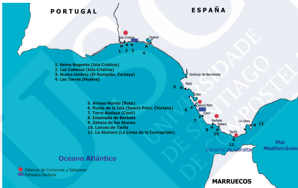
Mapa de las almadrabas e instalaciones asociadas activas durante el CNA