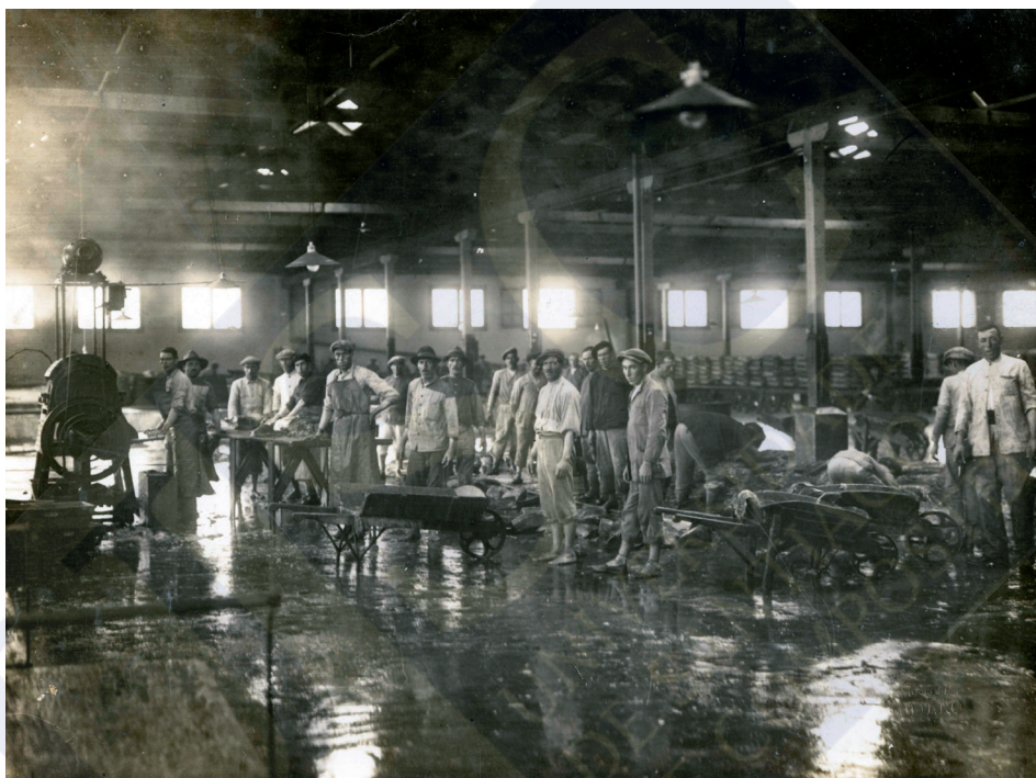
Interior de la Fábrica del CNA en Isla Cristina, hacia 1940

sectores como el de la industria naval. Es decir, se planificaba el núcleo poblacional al completo servicio de la empresa. El control de la empresa se plasmaba en una ordenación completa del sistema productivo, desde la captura al procesamiento, y se prolongaba en los poblados, con hábitats homogéneos y servicios para los trabajadores.