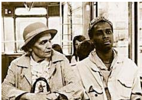
Figura5. Un momento del cortometraje El pasajero negro.

La sombra del nazismo, representado en una anciana intransigente que rápidamente se hace antipática al espectador, aparece en una sociedad donde turcos, italianos, musulmanes y africanos reciben miradas de discriminación y consideración de ciudadanos de segunda. Hay que tener en cuenta que en la Alemania reunificada, en 1992, se registraron más de dos mil ataques contra extranjeros y murieron diez y siete personas por mano de la violencia de la extrema derecha.