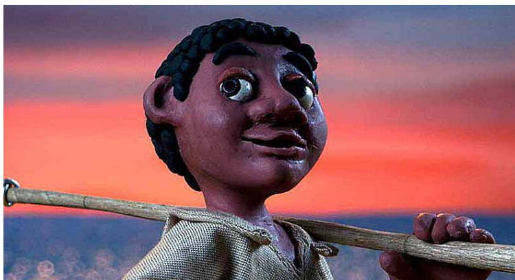
Figura7. El viaje de Said es un cortometraje de animación en plastilina.