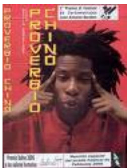
Figura3. Cartel de Proverbio chino.