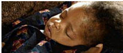
Figura2. El bebé del cortometraje Nana duerme placidamente.

Si para entender otra cultura diferente y propiciar lazos de interculturalidad no sólo hay que intentar comprender lo diferente, sino también buscar los elementos que unifican a las comunidades humanas, es decir, todo aquello que sirve para relacionar y agrupar en contra de