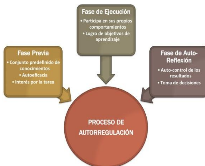
Figura 2: Fases del proceso de autorregulación del aprendizaje del estudiante

En la segunda fase, la fase de ejecución, el estudiante comienza a participar realmente en los comportamientos propios y necesarios para lograr con éxito sus objetivos. En concreto, el estudiante es capaz de realizar un seguimiento al progreso en su propio aprendizaje, así como el uso de estrategias seleccionadas para realizar las tareas de aprendizaje. Durante la última fase del modelo, la fase de auto-reflexión, los estudiantes usan el autocontrol de los resultados para tomar decisiones con respecto a su desempeño en el aprendizaje. Dependiendo de la naturaleza de los resultados, así como de las atribuciones, los estudiantes realizan juicios auto-evaluativos que pueden afectar al curso futuro de las acciones relacionadas con la primera fase del modelo, la fase de previsión. Los estudiantes autorregulados deben comprometerse en un circuito de retroalimentación cíclica hasta que alcancen con éxito sus objetivos.