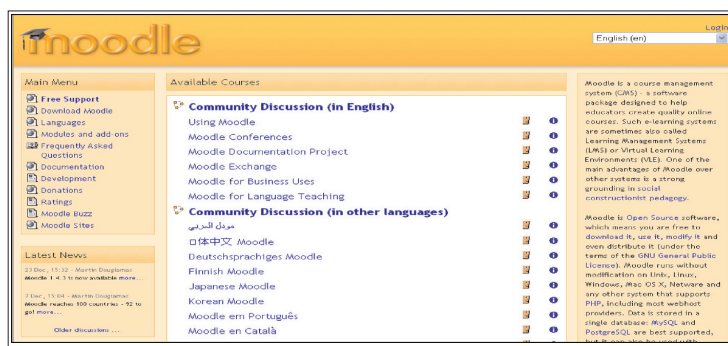
Imagen página principal «Moodle».