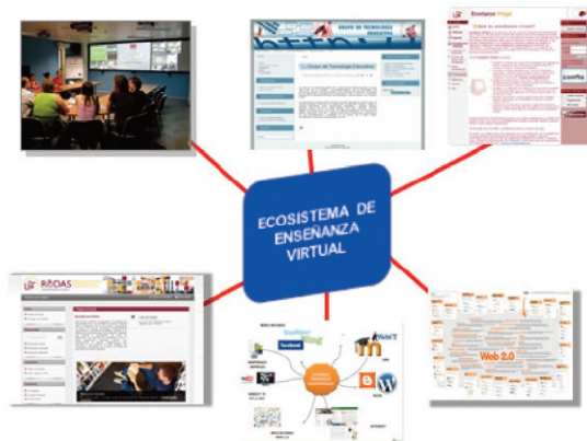
Figura 2. Ecosistema de formación virtual.

mente transmisivos y reproductivos, a modelos donde el alumno se convierte en el centro del escenario de la formación, y el rol del profesor se transforma de transmisor de información al de diseñador de situaciones medidas de aprendizaje, tanto individuales como grupales, para que los alumnos adquieran determinadas competencias y capacidades previstas para la acción formativa. Como se ha apuntado: “Lo afirmado nos lleva a señalar que por mucho que los LMS incorporen herramientas web 2.0 (blog, wikis, rsss,...), si no se da un cambio de actitud, seguiremos llevando a cabo acciones formativas virtuales meramente tradicionales y transmisoras, por muchas herramientas de la web 2.0 que incorporemos: blog, wikis, RSS,...” (Marín y Reche, 2012; Cabero, 2013).