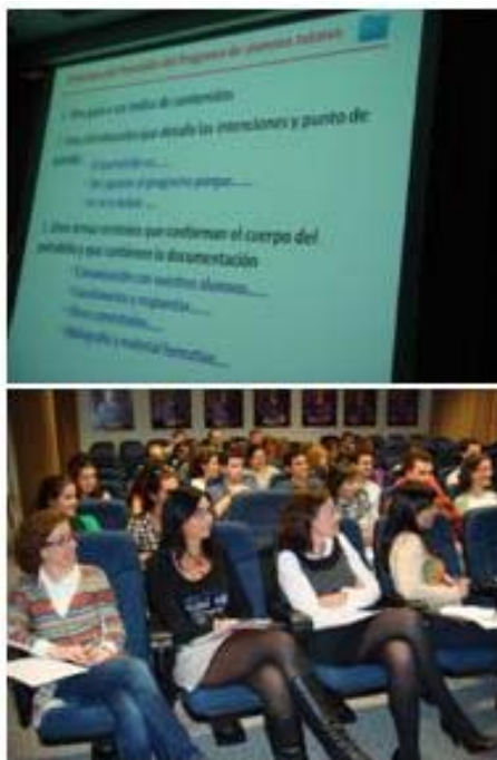
Figura 2. Fotos de diversas sesiones del Programa.