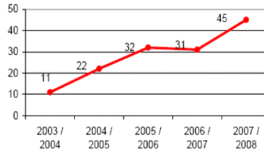
Tabla 1 y Gráfico 1. Centros que incorporan las TIC a la Educación Secundaria en Andalucía y Jaén.

diseñador de medios, moderadores y tutores virtuales, evaluadores continuos, asesores y orientadores.