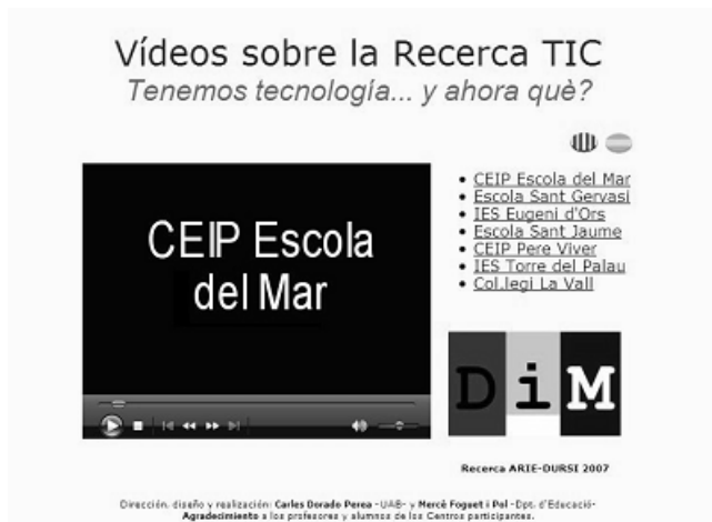
Figura 2. Vídeos de la investigación ( http://mem.uab.es/videos/recercaTIC/ ).