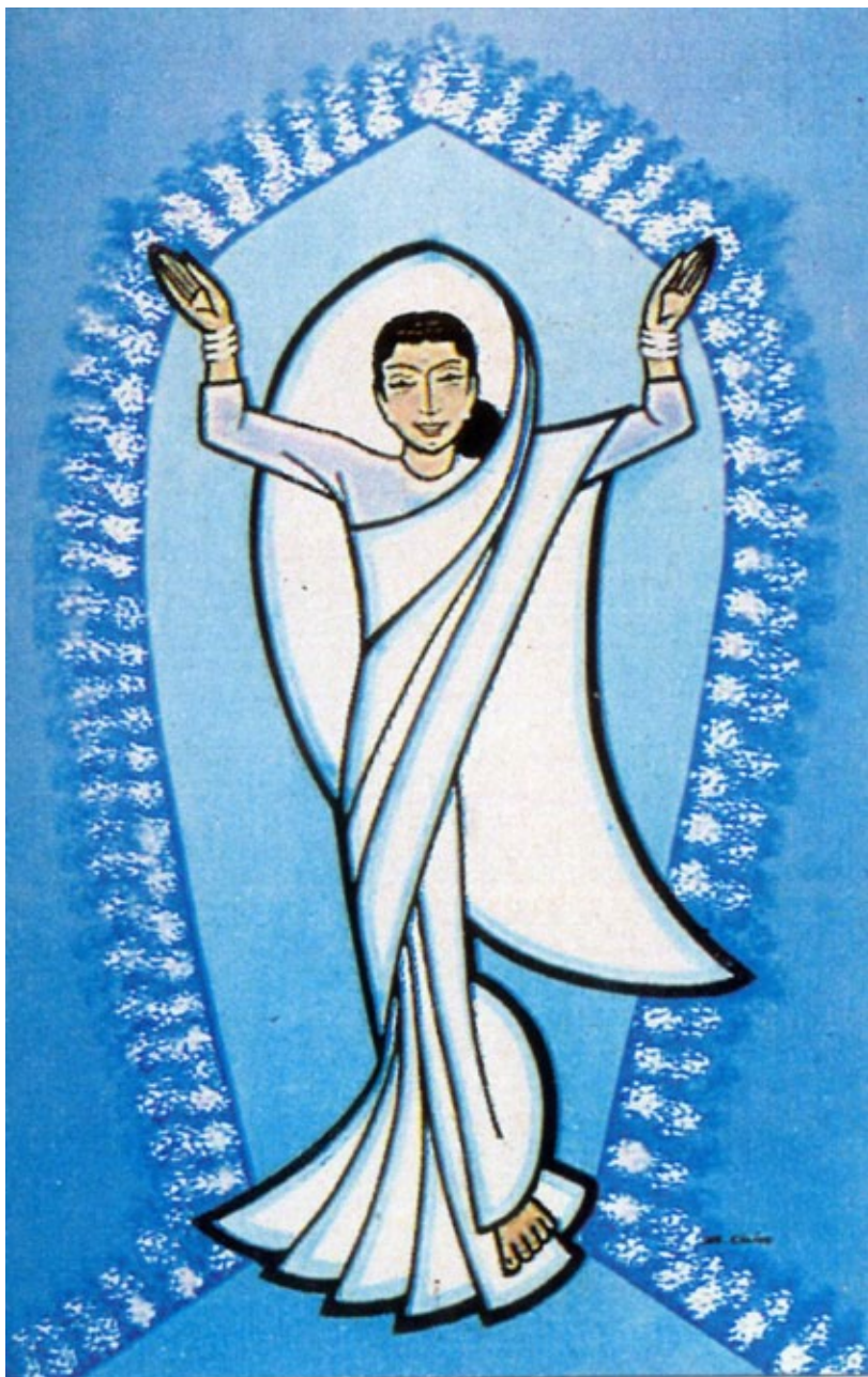
Fig. 2. “Mi espíritu se alegra en Dios”. Sister Claire.