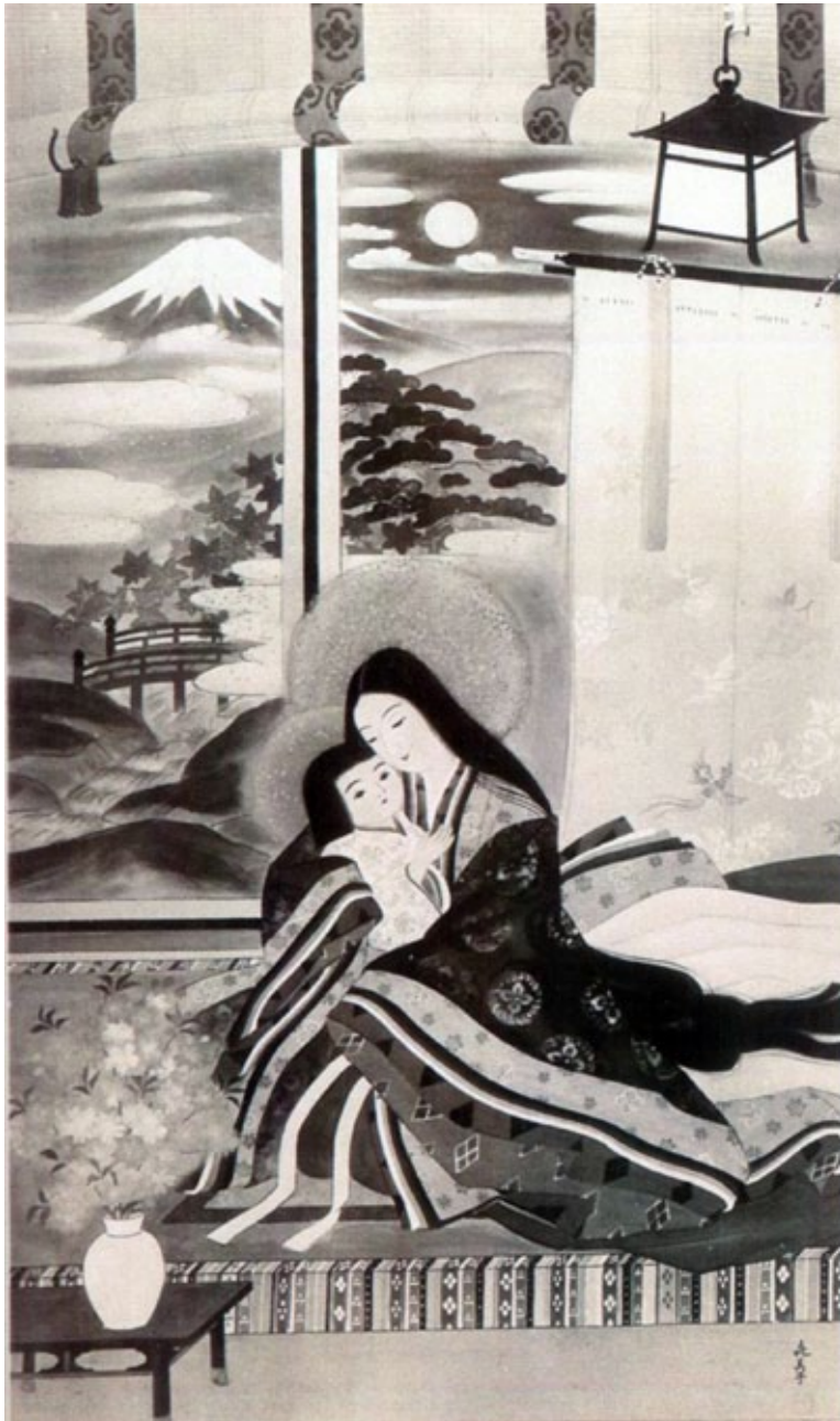
Fig. 7. La Virgen con el Niño en brazos. Teresa Kimiko Koseki.