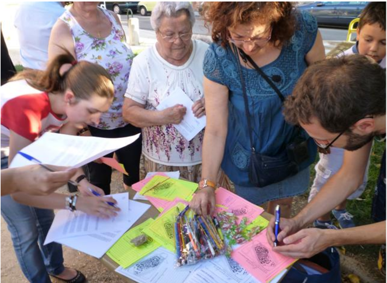
Figura 4. Taller “Recuerdos y Deseos”.

El proceso de acercamiento y generación de confianza de la primera etapa debe ser complementado con acciones propositivas, capaces de dar respuesta a las necesidades identificadas hasta el momento. La etapa de empoderamiento se inicia a través del taller vecinal “Recuerdos y Deseos” (Figura 4), dinámica participativa que dirige la mirada simultáneamente a la realidad pasada y a las oportunidades futuras, combinando las potencialidades de uno y otro.